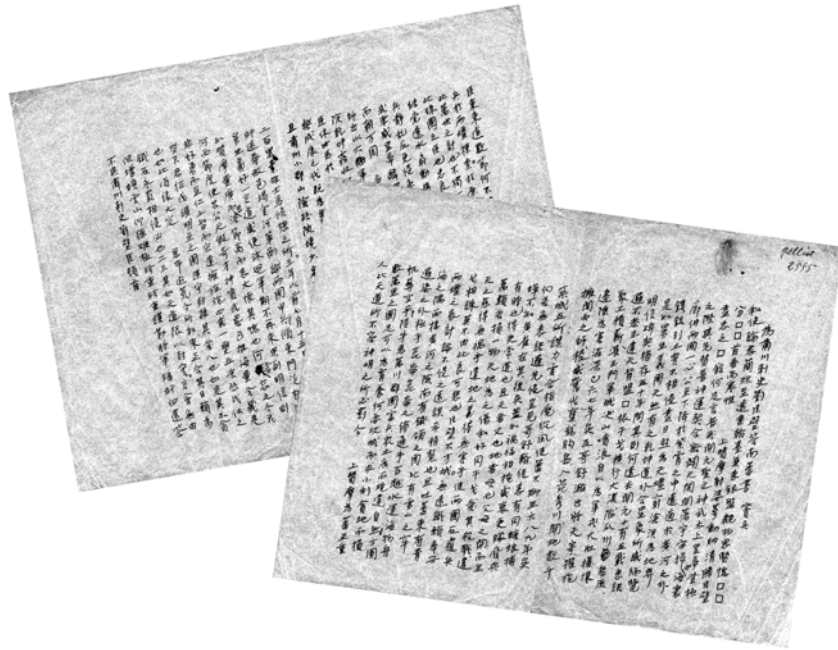
王重民先生手抄伯希和 2555 号“为肃州刺史刘臣璧答南蕃书”