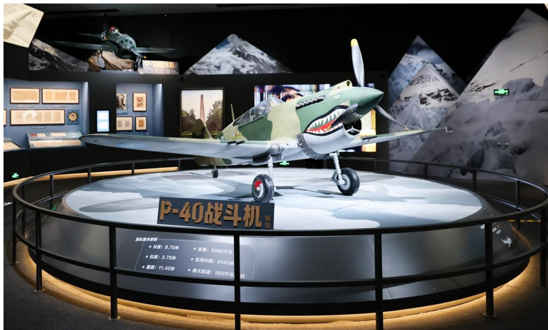
图 3 国家博物馆展厅中的 P-40 战斗机模型

①拍摄。其中美国飞虎队队员驾驶 P—40 战鹰战斗机的照片放在了报道开篇。这款战斗机机头上绘有鲨鱼嘴涂装，是其标志性外部特征，该设计灵感来源于北非一支英国 P—40 部队（英国皇家空军第 112 中队）使用的照片，飞虎队的地勤人员对其进行了改造，并用自己的飞机上，从而创造了航空史上经久不衰且极具威慑力的形象之一。这款战斗机的模型在今年 9 月份于国家博物馆开幕的《国际友人与中国抗战——纪念中国人民抗日战争暨世界反法西斯战争胜利 80 周年专题展》上展出，足见其对中美联合抗战的重要意义。