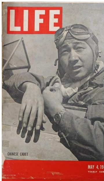
图 1 《生活》杂志第 12 卷第 18 期封面 1942 年 5 月 4 日

该杂志由亨利·R·卢斯 (Henry R. Luce) 创办于 1936 年 11 月 23 日。是 20 世纪最具影响力的文化标志之一, 其以强大、震撼且叙事性极强的新闻摄影照片改变了人们看世界的方式。