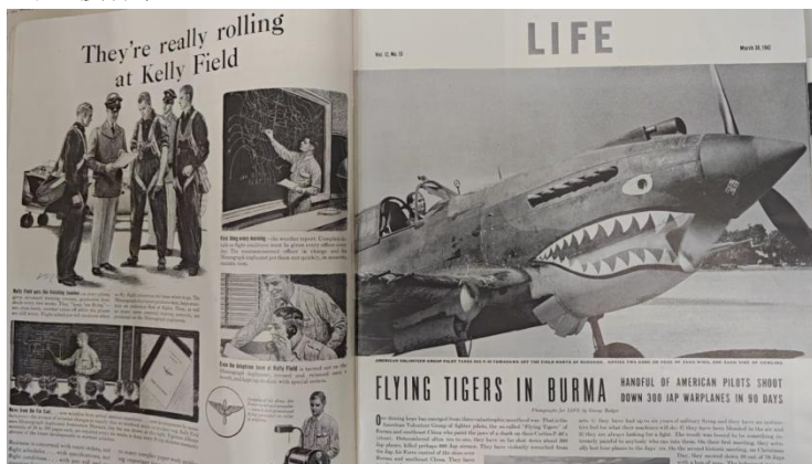
图 2 1942 年 3 月 30 日《生活》杂志关于飞虎队在缅甸的报道 美国飞虎队队员驾驶柯蒂斯 P-40 战鹰战斗机

1942 年后的两个卷期涉及到识别日本“零式”战斗机和军舰的图片，这是能够起到宣传作用的教学指南。珍珠港事变后，太平洋战争全面爆发，美国正式加入第二次世界大战。由于担心敌方空袭，美国民众迫切需要学会识别空中飞机是敌是友。报道以图文并茂的方式详细展示了日本“零式”战斗机、德国“梅塞施密特（Messerschmitt）”战斗机以及美国自身各型号飞机的轮廓、机翼和标志特征。这相当于一份面向全国公众的视觉识别手册，是战争时期特殊需求的直接体现。