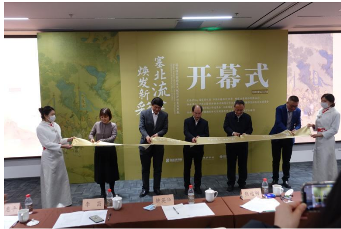
图 4 开幕式

修复过程中财通证券的领导、古保协会的领导们给予了持续的关注，多次到现场指导，还举行了结项鉴定会。结项后在北京国图创新文化服务有限公司支持下，西夏文献在津湾广场举办了修复成果展览，让更多的人了解西夏文献和文献修复。