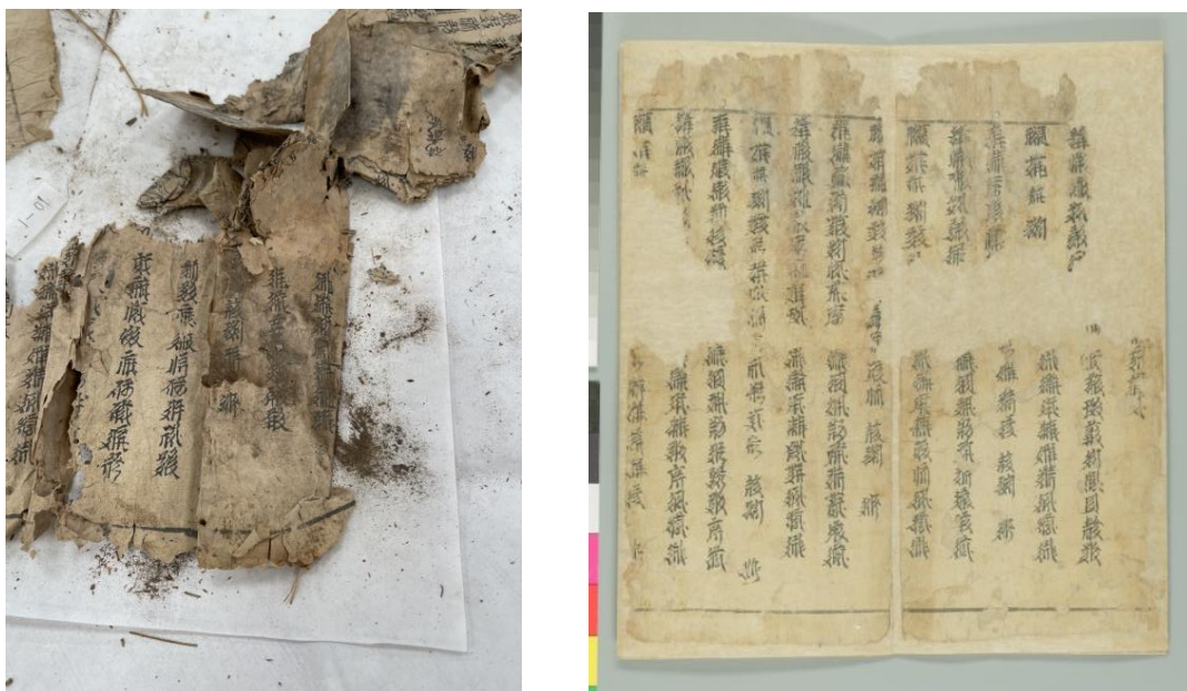
图1 西夏文献修复前后对比

2015年，国家图书馆入藏了一批西夏文献，共18包，其中8册较为完整，数百叶为残片。这是近百年来发现的数量最大、内容最丰富、版本与装帧类型最多的西夏文古籍文献。这批西夏文古籍采用卷轴装、经折装、包背装、缝绩装等多种装帧形式，内容涉及宗教、政治、经济、文化、历史、地理、艺术等诸多方面，特别是保存较为完整的抄本《碎金（杂写）》《新集碎金置掌文》《西夏谚语》《三才杂字》等十分珍贵，或可更多地破译西夏文密码。