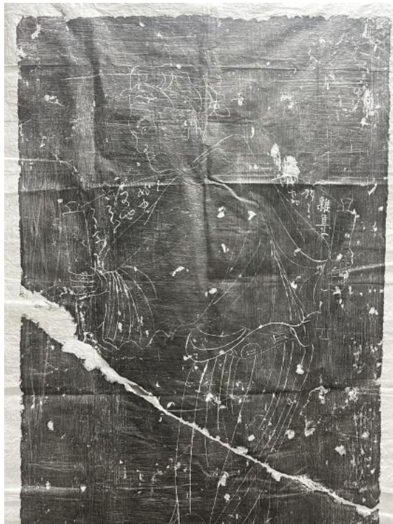
图 2 《椁壁线刻图·持卷读书》

第四批为《椁壁线刻图》拓片 1 种 8 张，此《椁壁线刻图》反映了唐代仕女生活的雅趣，其中持卷读书、抚琴演奏、赏蝶嬉戏等场景刻画细致，人物形象传神，具有很高的文献价值和艺术史研究价值。