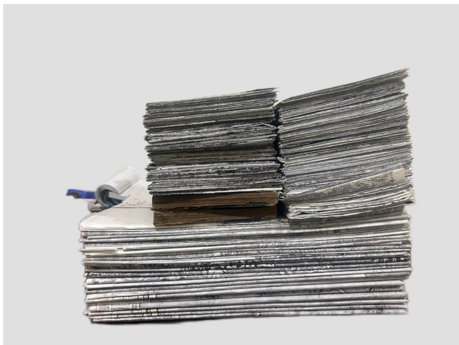
图5 2024年采进部分石刻拓片