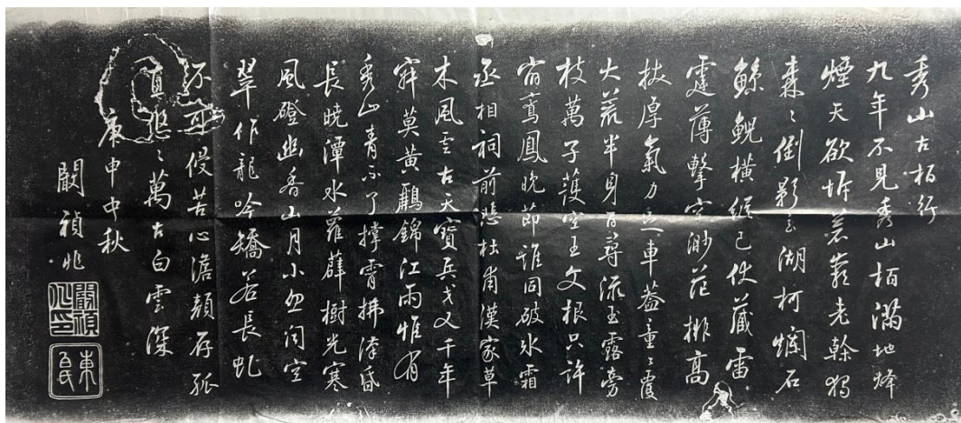
图3 闕禎兆书《秀山古柏行》

第六批为云南玉溪、保山等地石刻拓片共计56种65张。此批拓片我馆皆无收藏，多为云南玉溪、保山等地新发现的石刻，刻石年代以明清刻石为主，石刻类型多样，包括诰封碑、祠庙碑、诗词刻石、榜书、墓碑、塔铭等，比较集中地反映了当地石刻文化特点。此批刻石中多有清代著名书家王文治、闕禎兆、钟岳等人所书碑刻，如王文治书《同朱桐野游秀山诗刻四首》《晓字石匾》、闕禎兆书《秀山古柏行诗刻》《华严会会供碑》《涌金寺祖庭常住碑》、钟岳书《登山云海月堂间眺诗刻》《通翁亭碑》等，颇具书法艺术价值，其中闕禎兆、钟岳为云南当地的著名历史名家，闕禎兆（1641—1709），字诚斋，号东白，别号大渔，家富藏书，著有《大渔集》《北游草》《通海志》等。钟岳（1663—1755），字南冈，号醉柏山房主人，能书善画，有“南中高士”之称。此批拓片中另有《文庙碑》《通海学宫碑》《涌金禅林碑》等保存了当地祠庙相关历史，具有重要的文献价值。此批拓片原石多在深山险峻处，传拓极为不易，文献颇为难得。