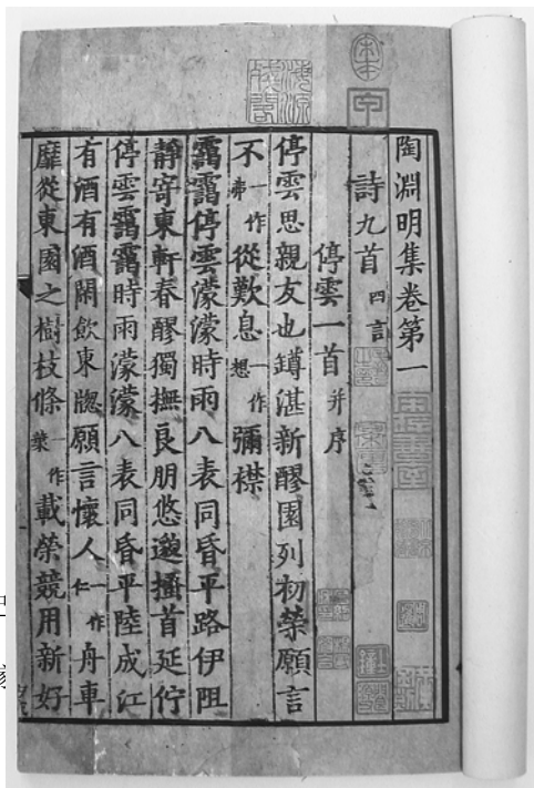
南宋刻递修本《陶渊明集》