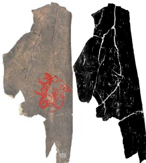
图2 《殷虚文字甲编》2422

甲骨卜辞中“虎”为猎获的对象，也用作祭祀祖先时的祭牲。前者如国图甲骨 12309（《甲骨文合集》20752）记载“甫”狩猎，猎获“鹿十、虎一、豕一”，国图甲骨 19718（《甲骨文合集》37366/37493）记载猎获“虎三”以及白狐和麀鹿。后者如国图甲骨 637（《甲骨文