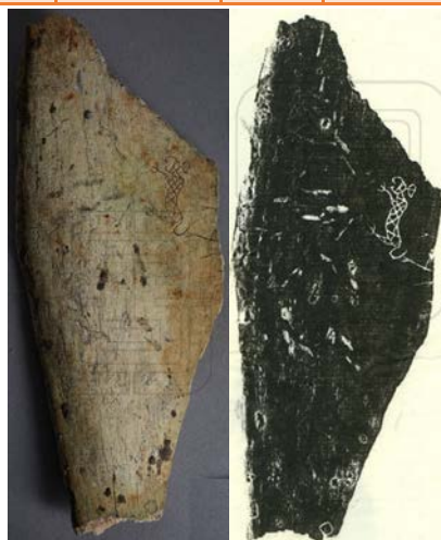
图1 国图甲骨 25282