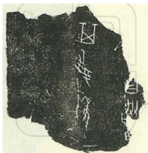
图3 国图藏甲骨 14427