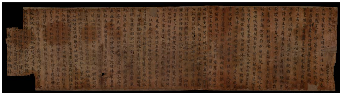
图 1 BD14667《开蒙要训》全图

《开蒙要训》是中国古代蒙童读物之一，据 P.2721 号《杂抄》“经史何人修撰制注”云：“《开蒙要训》，马仁寿撰之。”马仁寿，其生平未见史志记载，事迹不详。《开蒙要训》成书年代约在魏晋六朝之际，该书于唐五代时期在我国西北地区广为流传，但后世不传，敦煌文献存有写卷若干。