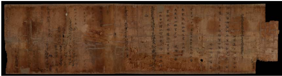
图3 BD14667 背

BD05203 为吐蕃统治时期写本，首脱尾残，正面抄写《大般若波罗蜜多经》卷二五九，卷背抄写《开蒙要训》两行，第一行“开蒙要训一卷乾坤覆载”，第二行“月光明四时来往八节相迎春花开”。