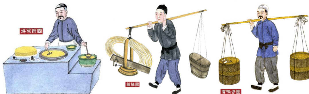
北京民间风俗百图

是满汉相互融合影响并相沿成习，是古代城市中的帝都气派、皇家情趣和市井民俗的综合体现。