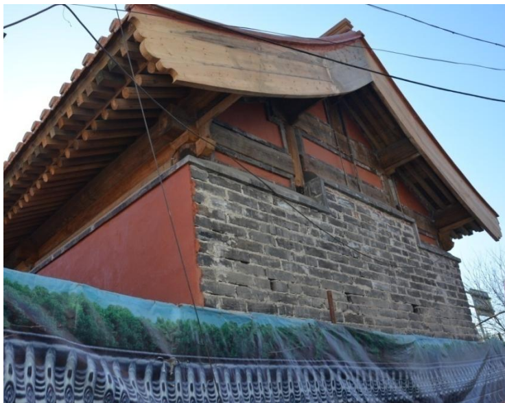
图 3: 复建中的燕翅楼