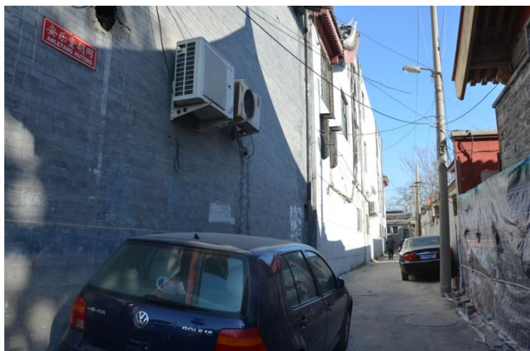
图 4：安乐堂胡同今貌