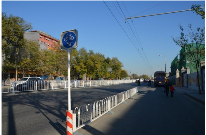
图 2: 地安门东大街

民国时期,为了便利交通,地安门东西两侧的城墙分别于1913年和1923年被拆除,城墙所处位置约在今地安门东西大街。