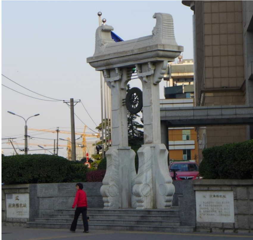
图 5：辽燕角楼故址纪念雕塑

子城的西南、西北、东南三个角都与城墙相交，只有东北角独立，所以建立了这个燕角楼，燕角谐音为烟阁、线阁，于是贯通这里的南北走向的南线阁路、北线阁路地名也由此而来。