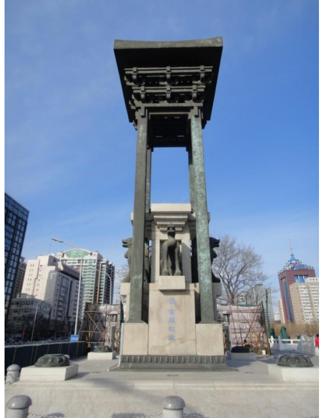
图 3：北京建都纪念阙

京城区，肇始斯地。其时惟周，其名曰蓟。”（图 3）柱前石碑上镌刻着侯仁之先生题写的《北京建城记》。这就是 1995 年为了纪念北京建城 3040 年而建立的“蓟城纪念柱”，即“北京建城纪念柱”。