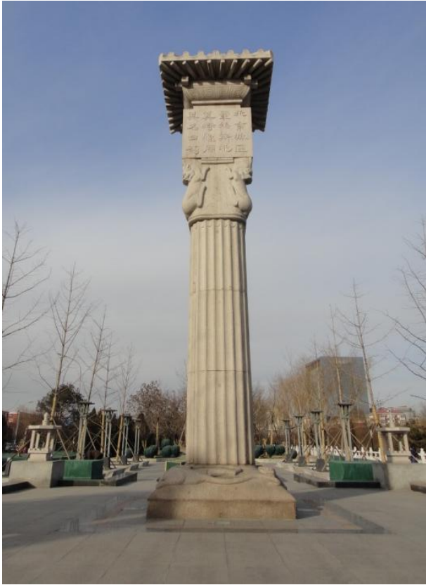
图 4：北京建城纪念柱