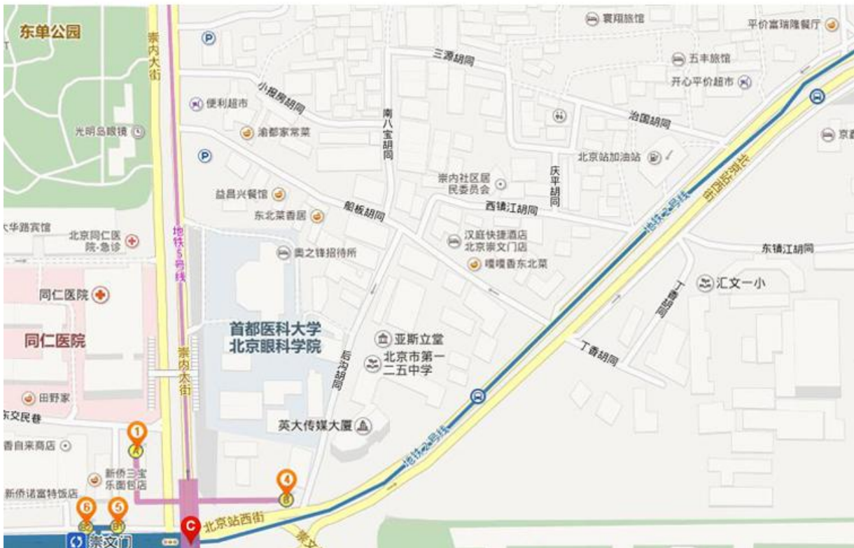
图 2: 《乾隆京城全图》与百度地图对比