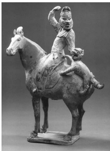
图 2：懿德太子墓发现的文物

古代的焉耆、龟兹和吐鲁番盆地从 3 世纪到 10 世纪流行着一种语言，刚发现时是一种不知道名字的语言，是一种死语言，后来慢慢才知道是吐火罗语。所谓印欧语系下面有两支，一是现在的日耳曼语、英语、法语、西班牙语；另外一支就是印度伊朗语。吐火罗语属于印欧语的西支，而在和田、粟特发现的印欧语属印欧语的东支。吐火罗语的发现对于世界的语言学史是非常重要的，而且吐火罗语的价值也是非常大的，因为它是死语言，没有受到后来的干扰，他保留了原有中古时代的状态。在吐鲁番盆地到焉耆到库车流行着两种吐火罗语，一种是吐火罗语 A，一种是吐火罗语