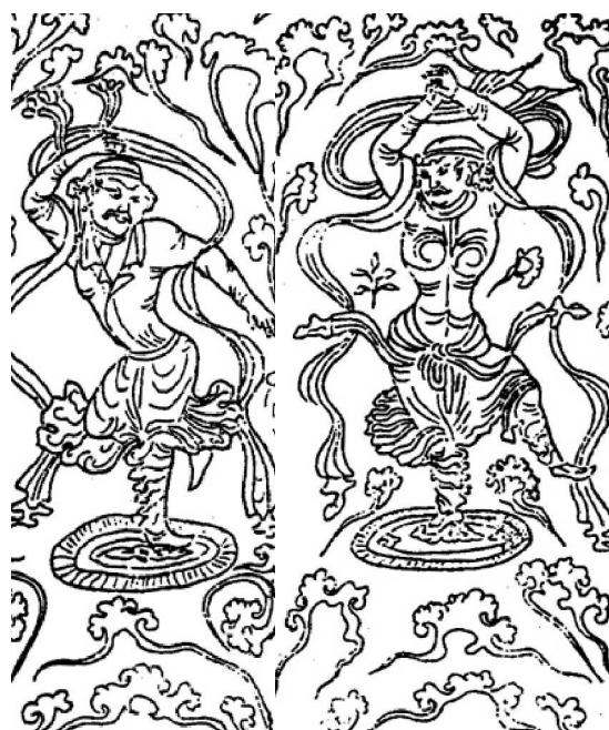
图 1: 宁夏盐池 M6 号墓石门上的胡旋舞形象

宁夏盐池县发现的粟特人的墓。在这个墓门上画着跳胡旋舞的粟特人。他穿着锦绣的衣，翻领紧口的胡服，然后踩在一个椭圆的毡垫上，旋转如飞的跳着胡旋舞。（见图 1）