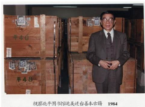
视察北平图书馆迁美迁台善本古籍 1984

考部主任。1947 年赴美，作为北平图书馆交换馆员到芝加哥大学图书馆工作和进修。1957 年获芝加哥大学图书馆博士学位。1947 至 1978 年担任芝加哥大学远东图书馆馆长，兼任东亚语言文化学系教授，主讲《中国目录学》和《中国史学方法》，从 1964 年至 1978 年间先后培养了 30 多位硕士和博士生。退休后，任东亚语言文化学系荣誉教授、东亚图书馆荣誉馆长和李约瑟研究所研究员。钱