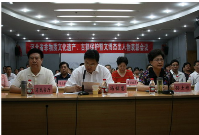
副省长孙士彬、省文化厅厅长冯韶慧出席会议

6月11日下午，文化部、国家文物局在国务院召开全国非物质文化遗产保护、古籍保护暨文博事业杰出人物表彰、颁证、授牌电视电话会议，会上河北省共有7家单位和42名个人获表彰。我省分会场设在承德，副省长孙士彬、省文化厅厅长冯韶慧