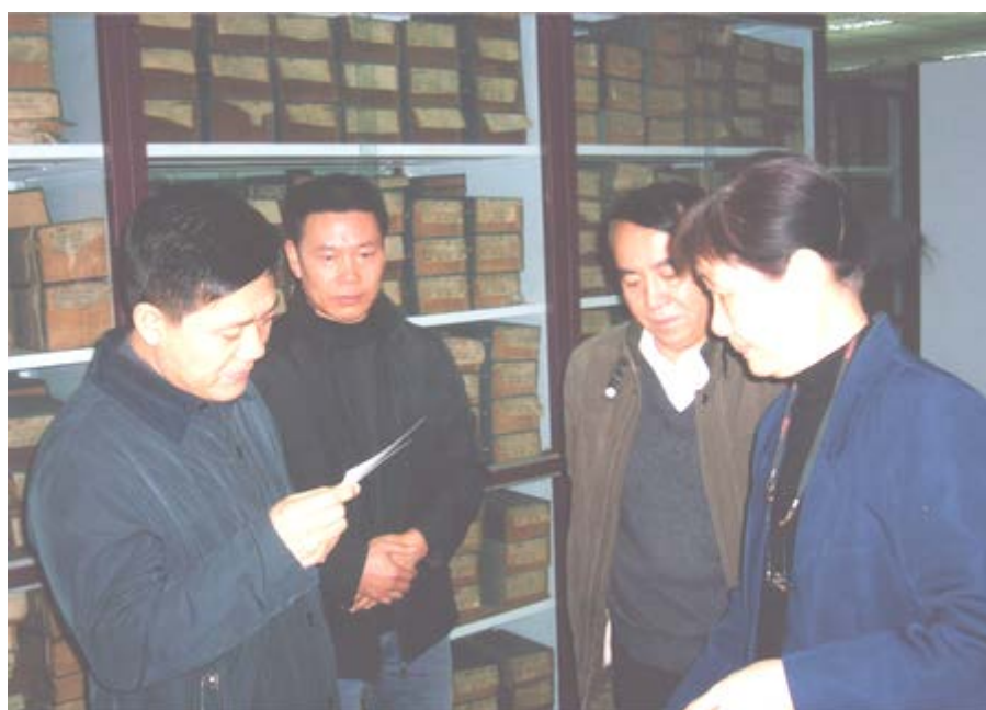
保定市委副书记孟祥伟、文化局局长王福友视察古籍阅览室

库和珍本古籍起到了有效地保护。在2009年，市财政预算拨款50万元用于古籍保护等基础设施建设。据悉，该款已经划拨到账。保定市图书馆的古籍保护工作将会得到极大的改善。