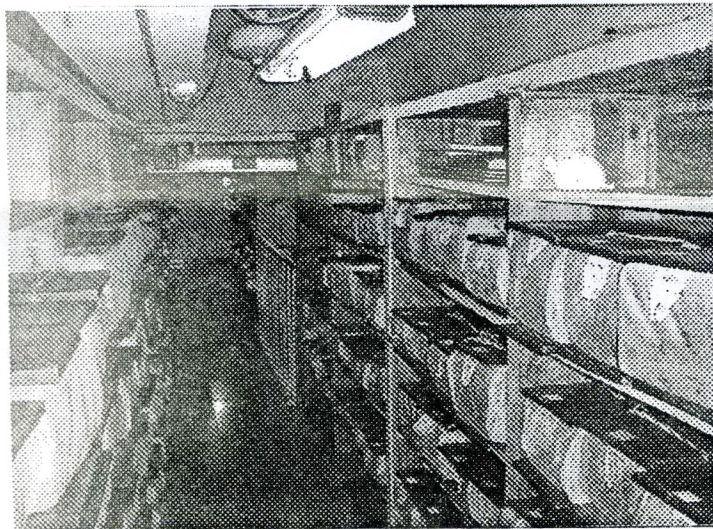
蒙古国国家图书馆古籍书库藏书

内蒙古图书馆将协助蒙古国国家图书馆进行馆藏汉文文献的整理工作。根据意向，内蒙古图书馆将派业务骨干协助蒙古国国家图书馆对其馆藏的汉文图书进行整理和目录编纂。