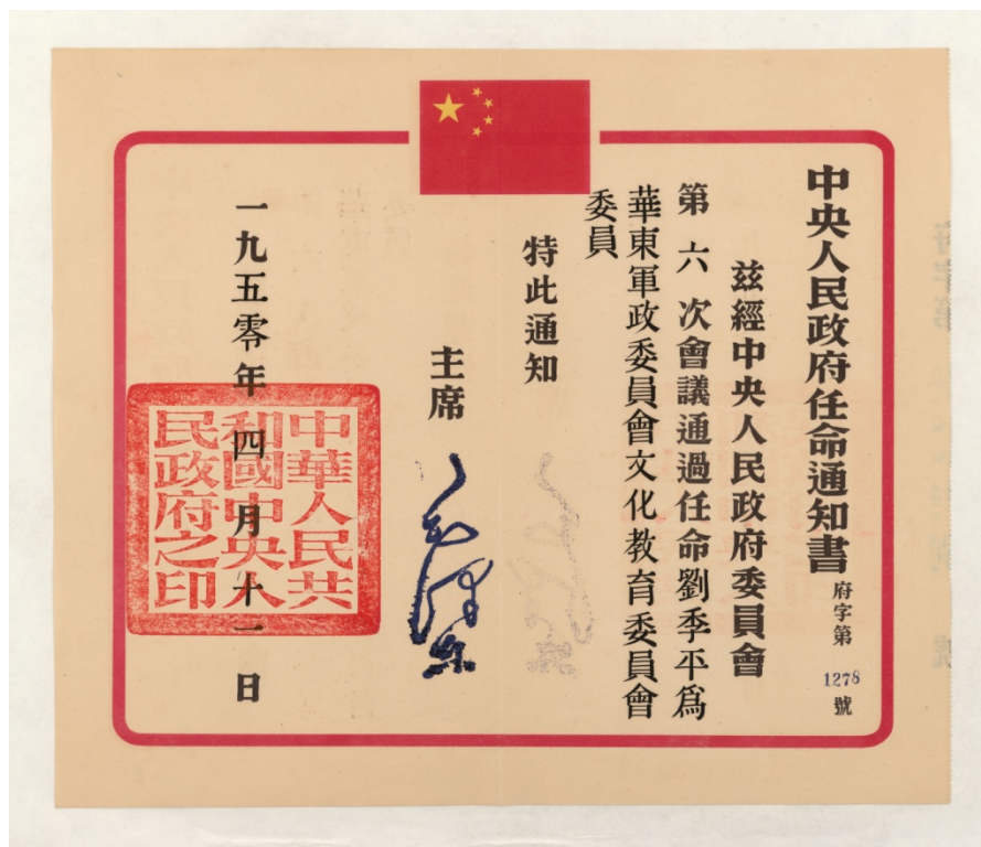
图2 中央人民政府任命通知书（府字第1278号）

毛泽东签发。通知“兹经中央人民政府委员会第六次会议通过，任命刘季平为华东军政委员会文化教育委员会委员”，钤“中华人民共和国中央人民政府之印”。用中央人民政府任命通知书专用信封（实寄封）。