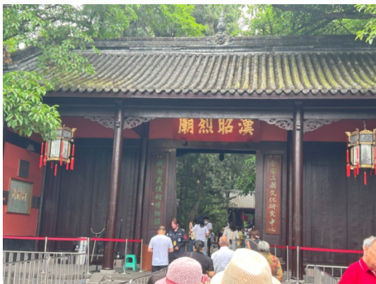
图 1 武侯祠

武侯祠内三国元素颇多，最感兴趣的还是园内碑刻，此地最有名的当属“蜀丞相诸葛武侯祠堂碑”，唐宪宗元和四年（809）立，由宰相裴度撰，著名书法家柳公权之兄柳公绰正书，蜀中名匠手鲁建刊刻。文章、书法、刻工均为难得精品，人称“三绝碑”。