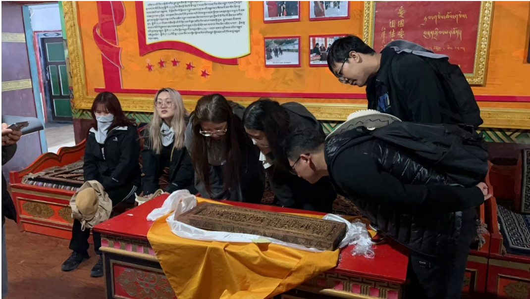
图 18 孜托寺观书板