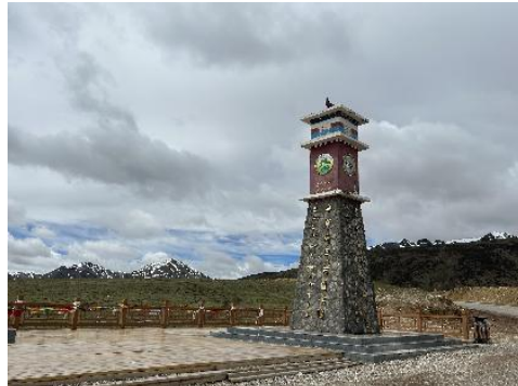
图 5 磨坡拉山地标 2