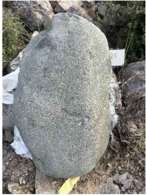
图 30 墓石编号

六点半收摊，格尔玛带我们去镇上机关食堂，有西瓜、尖椒牛肉丝、卤鸡翅、西红柿炒蛋、辣子鸡等，取大碗米饭，很下饭。