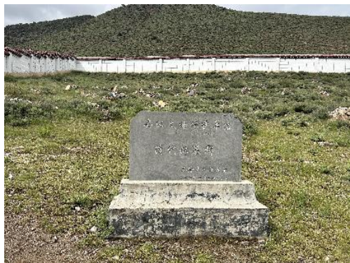
图 10 硕督镇汉族墓葬群