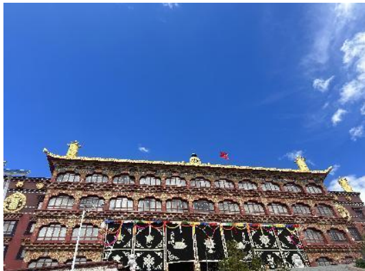
图 43 孜珠寺大殿

远处就听到寺院僧人集体诵经，金黄的屋顶在蓝天白云下显得格外亮眼。据寺院前树立石牌介绍：孜珠寺位于昌都市丁青县沙贡乡境内著名神山——孜珠山上，距丁青县城约 45 公里，海拔 4800 米左右，是藏区现存规模最大、海拔最高、教徒最多、苯教仪轨保存最完整的寺庙之一，也是雍仲苯教最古老、最重要的寺庙之一。孜珠山是古象雄文明外象雄的中心，据传，孜珠寺是第二代藏王穆赤赞布（生于公元前 1075 年）在雪域创建的 37 个最早的修行中心之一，至今已有一千多年的历史。孜珠寺独具特色的苯教佛事活动——神舞法会，每隔十二年藏历鸡年五月十五日举行，法会历时半个多月，其以“阎罗十二判”为主线，展示善恶因果报应的规律，包括祈祷、消业、祈福、超度等，最后一天进入浩大的神舞表演。孜珠寺藏有一批颇具价值的文物、古籍、古迹，是体现、记载象雄文明的重要资料，2014 年 11 月《古象雄大藏经》汉译、研究列为国家社科基金重大项目，孜珠寺主持丁真祖普俄色活佛是项目主译师。