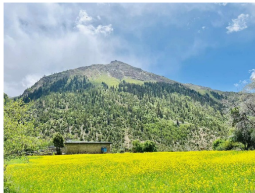
图 24 洛隆风景 2