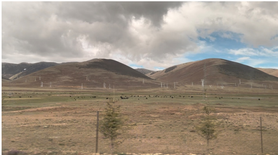
图 3 邦达草原

六点二十餐毕，退房，酒店门口等候去机场的摆渡车，六点半车准时来，停留一分钟准时发车，进双流机场，托运行李、安检，在第 177 号登机口等候上机。七点五十上飞机，八点半准时起飞，国航窄机，起飞颠簸明显，冲上云霄后渐平稳，今日云层较厚，可见厚厚云海，进藏后又时而可见雪山，心理较为平静，没过多想高原反应。九点十五分，广播提示准备降落，稍颠簸，微微颤，似过山车，九点五十五准时降落邦达机场。出机舱，无廊桥，凉风习习，如内地深秋季。落地即感头重脚轻，如头晚喝酒，第二天上头，脚下如踩棉花，肩上如负重担。但见周围雄山环绕，如着淡墨的云层在远山之巅，顿觉天高地远，心旷神怡。一阵冷风吹来，赶紧开箱穿厚衣。步履缓缓，挪向机场出口。洛隆组织部有人来接，电话联系后，上一辆丰田普拉多，驱车前往洛隆县。司机为本地人，开车极为大胆，邦达机场至洛隆多为盘山公路，司机如开跑跑卡丁车，270 度大弯急刹急停，又瞬间快速起步，5、6 个小时的路程压缩至 4 小时，颠来颠去，屁股时常离座腾起。