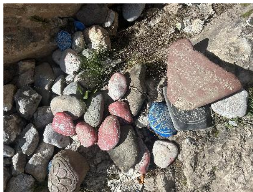
图 44 孜珠寺玛尼石

围绕孜珠寺慢慢转一圈，随处可见的五彩斑斓的玛尼石、风马旗把孜珠寺点缀的绚烂多彩。在孜珠寺停留两个多小时，乘车返回。回到洛隆县城已近八点，收拾行李，归置好拓片，早睡，明天一早五点出发乘车去邦达机场。