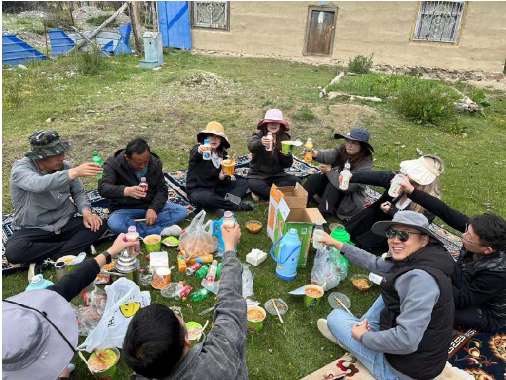
图 28 野餐