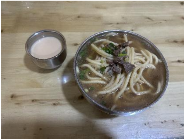
图 21 藏面