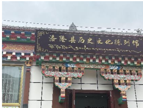
图 11 洛隆县历史文化陈列馆

睹此，心里颇为凄凄，戍边将士既然不能东还，就选择东望吧！需要传拓的就是坟前未经打磨的识墓标识。怀着敬畏之心围坟场转一圈，能传拓的约有四十余石，接续昨天复旦同仁的工作，把能传拓且能搬得动的石头由当地居民搬进旁边陈列馆，在室内传拓。石头进屋后马上摆家什、脱外套，选石头、裁纸、洗石头、上纸、刷纸入字口、打刷敲打、等晾干、上墨、揭纸。石头不均匀，上纸、上墨都有不少困难，好在石头不大，不知不觉上午已拓三纸。