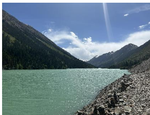
图 26 洛隆风景 4