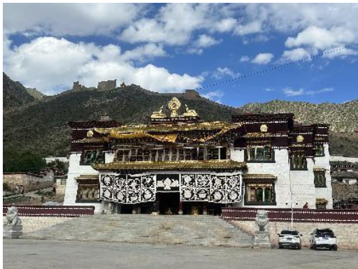
图 19 硕督寺