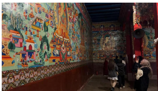
图 16 孜托寺壁画

车来去硕督寺，秦易告诫大家进入寺庙要脱帽，大家均会意。进入硕督寺，大殿上双鹿法轮在蓝天白云下更显金碧辉煌，进入正殿，僧人正在集体诵经，场面稍震撼，僧人均着红衣，赤脚。寺庙主事僧人为我们介绍墙壁壁画，知其多为元明清时期古画，很珍贵。出硕督寺往观县政府旧址，即硕督宗解放委员会旧址，已破败，知县里无经费修缮，深感可惜。返回洛隆县城，参观秦易办公室，感其简约又不失九零后年轻人的活力。晚餐毕，在县宗教办翟主任的带领下前往孜托寺，翟主任亲自讲解，颇为具体详细，接触不少藏传佛教知识。翟主任宗教知识渊博，为人热情厚到，没吃晚饭即来陪我们，深感谢意！在休息室寺主拿出珍藏雕刻精美木板一块，长约八十厘米，宽约二十厘米，寺主不知此为何物，其他人大多第一次见，拍照请教萨仁高娃老师，知是藏文梵夹装佛经的上夹板，众人得以解惑，然只剩此上夹板，佛经则不见踪