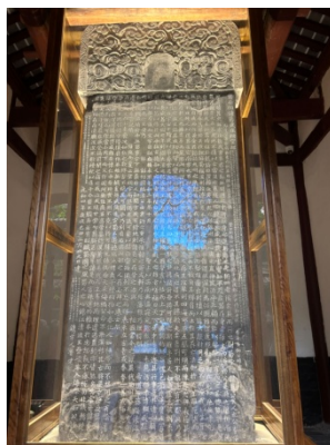
图 2 “三绝碑”