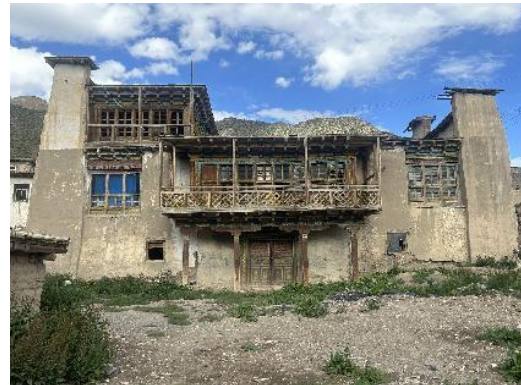
图 20 硕督宗解放委员会办公遗址