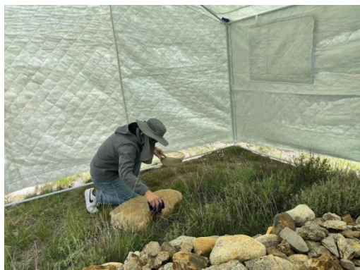
图 14 室外传拓洗石（宋凯）

今天要拓室外的石头，先搭帐篷，在搭帐篷期间，对墓葬石刻拍照、编号，避免石头取走送回时放错，也避免已传拓的石头再次搬进去，一上午都在做基建工作。十二点半左右去镇上机关食堂午餐，端午节过节的缘故，午餐有大块牦牛肉、卤鸡肉、油焖虾、龙虾尾、牛肉汤煮土豆，每人还有一听冰镇可乐，大块牦牛肉肉质非常紧实，卤鸡肉略辣，龙虾尾更甚，总之美味、抗饿的一餐。午餐后秦易来，能言善交流，餐厅闲聊十分钟，坐车去陈列馆。