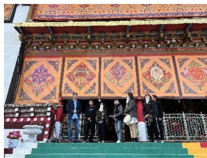
图 17 孜托寺翟主任讲解