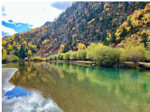
图 23 洛隆风景 1