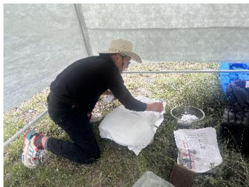
图 15 室外传拓上纸（刘 ）

拓室外稍大石，上纸、擦纸、上墨，风不停，抢拓两张，墨稍均，品相稍好。观格尔玛跃跃欲试，鼓励其尝试一下，勉强拓成，自为欣喜。忽山雨欲来，大晴天到下雨点不过短短两三分钟，大家及时退回陈列室。一刻钟左右雨停，在陈列室继续传拓，秦易欲拓藏语六字真言，大家围观，在众人的指指点下拓而成之，满心欢喜。忽宣布再工作半小时，五点左右收摊，去参观硕督寺、县政府旧址，再回城参观孜托寺，大家明显加快工作节奏。这两天有些发力过猛，明显感觉胳膊已经抬不起来了。收摊等车期间，大家分享秦易带来的饮料，尝了下青稞酒，口感略同米酒，回甘，可接受。