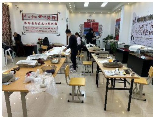
图 13 陈列馆工作室

上纸需双手来回刷，上墨需持臂连续打，两者都需要精神专注，胳膊顿感酸爽无比。十二点半左右，通知去镇上用餐，在狭小的镇机关食堂吃了西瓜、李子，皆可口。结识格尔玛，92年的阿坝藏族棒小伙，请我们喝了甜茶，味同不加珍珠的珍珠奶茶，奶香浓郁，深受女士们的喜爱。下午继续拓，陈列室热火朝天，每人都守着一块石头，或洗，或擦，或上纸，或敲打。期间换了三块石头，加上昨日复旦同仁完成的数量，两天大概传拓碑石 14 块，约 60 余张。至六点收摊，深感今日颇有收获！上车去县政府机关食堂用晚餐，餐毕走向宾馆，路过超市，买了脸盆、洗衣粉。从早晨出宾馆到回宾馆 11 个小时竟没上厕所。