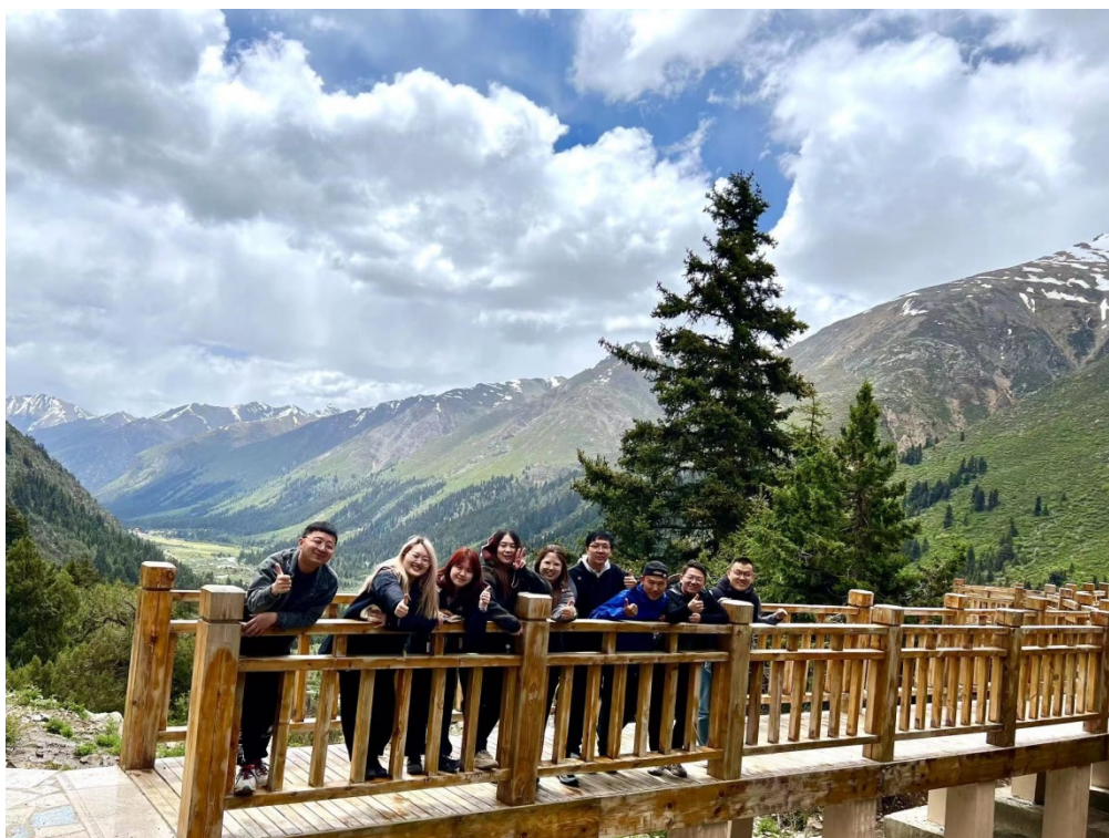
图 27 集体照