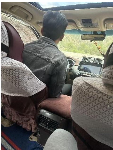
图 45 路遇山石滑坡

早五点文旅局派车来接，黑暗中沿山路奔向邦达机场。天亮后看到怒江在两山之间缓缓流动，像是在道别。盘山路上遇山石滚落，司机小心翼翼看着山坡慢慢移动车辆，有惊无险。349国道穿过邦达草原，人烟稀少的原因显得格外空旷，星星点点的黑色牦牛点缀着草原的暗绿色，若不是远山阻隔，公路便能与天相接。