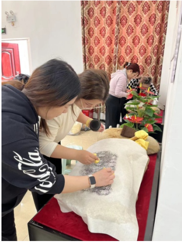
图 31 室内传拓（复旦大学同仁）