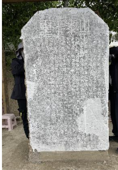
图 40 纪念碑上纸

八点左右出发去孜珠寺，路程约 3 小时，沿途要翻过两座山，普拉达从山下盘到山上，再从山上盘到山下，惊险刺激，跌宕起伏，司机师傅习以为常，车速依然很快，或刹、或转，得心应手。盘山路窄而不平，超车几乎不可能，行程中一辆皮卡始终在我们车前扬尘疾行，甚至能一路听到加油声，两小时后两车终于停下休整，皮卡车司机竟是我们司机师傅的亲兄弟。进入丁青县，孜珠寺已隐约可见，上山前在山下一个云南餐馆吃碗面，年轻的云南夫妇很热情，男主厨房，女主店面，俩人配合无间，顺序井然。沿山路爬向孜珠寺，山路稍宽些，也平坦很多，对向来车可以错开，人、车渐多，多是其他省份自驾旅游，看车牌有京、沪、浙、豫、鲁、冀、湘、贵、川等地。沿路山坡草地上绿草茵茵，牦牛星星点点，又有野生山鹿不时出现。孜珠寺进入眼帘，巍峨壮观，天空中低飞的秃鹫颇让此地显得神秘。