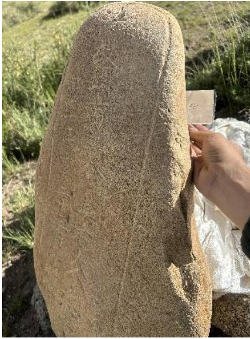
图 29 墓石编号