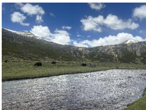
图 25 洛隆风景 3