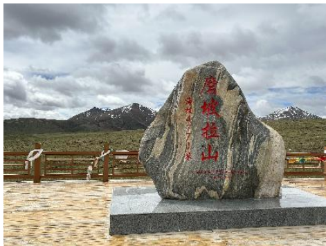
图 4 磨坡拉山地标 1

好在沿途景色壮丽，又能呼吸新鲜空气，心情畅快许多。邦达草原辽阔壮观，黑色或棕色牦牛如星罗棋布，而以黑色者居多，近看体肥而健硕，目测有八百多斤。沿途群山或巍峨，或陡峭，或原生针叶树木密布，或如被绿植铺满山坡，又见有寸草不生者，有山石滚动痕迹，最为危险，盘山公路常受此威胁！爬磨坡拉山，此处海拔 4771 米，为此行最高点，停车稍作休整，在地标处拍照留念。