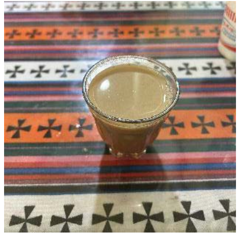
图 22 甜茶

上车，目的地一：前往巴堆村，欣赏小溪草地牦牛、油菜花、巴东措湖。一路盘山公路，一部分还是砂石路，非常颠簸。十点半左右到达一处开阔的小溪草地，有牦牛涉水啃食青草，溪水清澈见底，司机师傅直接下车用手捧水喝下，非常干净。杜鹃花在山坡上生长，本地多处寺庙楼顶的一部分建筑都是用这种杜鹃枝一层一层压实建造的。一处平坦又斑驳的呈圆形的低矮石台，司机师傅说当地人称其为“女鬼砍刀”，不知为何有这种传说。秦易、格尔玛爬上山坡，匍匐搜索，言之凿凿地说可以找到虫草。十分钟后二位都放弃了。继续前行，一小时后在一处桥边停下，看远处油菜花成片接次连接，在蓝天、远山、白云下交相辉映，一座低矮的小房子显得颇为静谧。桥下涓涓溪流，不断前行，清澈见底的石块遍布整个河道，桥上两边堆放着大小不一的玛尼石，六字真言刻画深刻，是当地祈福所用。驱车继续前进，一路往上走，在一片较为平坦的原上看到采虫草的藏族同胞们搭的帐篷，有三五处，秦易招呼大家进帐篷，里面非常暖和，可以烧劈柴，烧水、做饭、睡觉。此处虫草有售，大约听到十四只虫草卖七百，去年大概五百，越来越贵了。继续前行，到达巴堆村，下车在观景台拍照留影，溪水在两山之间越走越远，直与远山融为一体。前往巴东措湖，下车后沿湖边小块砾石前行，凉风习习，湖水一片碧绿，三五根硕大木头简单搭建了一座木桥，桥下水流奔腾，不远处就有石头堆起来的拦水坝，水坝上面安静平静，一片辽阔，湖边一排堆起的石块，是一种祈福行为，此处不可以大声喊叫、撒尿，据说有这种禁忌会生病。在巴东措湖放空十来分钟，返回。在一个村子里借了热水，方便泡面，还有格尔玛早晨买的凉面、卤鸡、饮料，热情的村民还送来当地特色炸麻花一类食物，还有刚出锅的牛肉包子，非常有意义的野餐。饭饱打扫卫生，去第二个目的地：江云村采摘车厘子。驱车一个多小时，到达江云村委会，在驻村干部的带领下来到果园，车厘子正好熟，秦易招呼大家可以免费吃，诸位都很兴奋，不同的树，口感不同，大家围在一棵甜度可口的车厘子树下，不一会儿树下果实就见光了。继续找新的目标，众人欢笑一片，非常满足。秦易自费五百元，买些车厘子带走。走出果园，第一次见熟了的青稞，跟麦子很像。路过村头，看到一棵上百年的桑椹树，三五人竟不能合抱，实在罕见。驱车返回，路过五指山，到达五指山脚下已经晚九点多了，天已经黑了，隐约可见五指山，数颗星星在山上点缀，方圆数十里无人烟，没有任何一点声音，仿佛进入一个空寂的时空。停留一会儿，驱车返回县城，到宾馆已经十点多了，洗漱睡觉，又累又满足的一天。