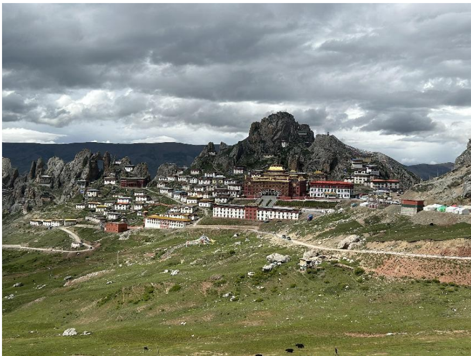
图 42 孜珠寺远景

远处就听到寺院僧人集体诵经，金黄的屋顶在蓝天白云下显得格外亮眼。据寺院前树立石牌介绍：孜珠寺位于昌都市丁青县沙贡乡境内著名神山——孜珠山上，距丁青县城约 45 公里，海拔 4800 米左右，是藏区现存规模最大、海拔最高、教徒最多、苯教仪轨保存最完整的寺庙之一，也是雍仲苯教最古老、最重要的寺庙之一。孜珠山是古象雄文明外象雄的中心，据传，孜珠寺是第二代藏王穆赤赞布（生于公元前 1075 年）在雪域创建的 37 个最早的修行中心之一，至今已有一千多年的历史。孜珠寺独具特色的苯教佛事活动——神舞法会，每隔十二年藏历鸡年五月十五日举行，法会历时半个多月，其以“阎罗十二判”为主线，展示善恶因果报应的规律，包括祈祷、消业、祈福、超度等，最后一天进入浩大的神舞表演。孜珠寺藏有一批颇具价值的文物、古籍、古迹，是体现、记载象雄文明的重要资料，2014 年 11 月《古象雄大藏经》汉译、研究列为国家社科基金重大项目，孜珠寺主持丁真祖普俄色活佛是项目主译师。