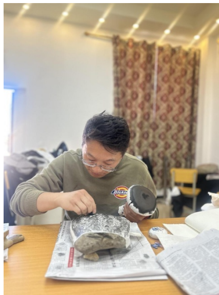
图 33 室内传拓（刘 ）

十二点半左右格尔玛叫我们吃饭，一直到一点才收尾，到机关食堂，有西瓜、回锅肉、牛肉干、土豆条，都很可口。受邀去藏族同胞家看古物，有瓷碗、铜钱、商人账簿、顶戴花翎等，多为清末民初时的物件，其中大家讨论最多的是商人账簿，宣统时期物，有方戳：“疆城风窝街洪廣纸局自造”，商人用账簿记载很少，而僧人用其记录法事较多，当两不相扰。从同胞家出来继续拓石，工作三小时，拓纸五六张。六点半返回县城，路上旺拉局长电话通知说晚上县委书记和我们一起在机关食堂用餐，到机关食堂后，林县已到，稍等一会儿，谢文光书记到，很和善、亲切，山东平原人，任继愈先生的同乡，山师本科，清华硕士，年轻有为，桌上有说有笑，无拘无束。饭后，书记请我们到他办公室参观，一间小屋，一张桌子，墙上挂着洛隆县地图，很朴实。未停留，书记送我们上车，还电话联系送氧气瓶到宾馆，相约明天一早一同去硕督镇拓石。