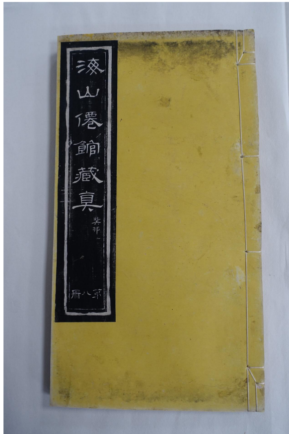
图9 整册修复后外观图

拓本的成书形式不止有线装, 还有经折装、册页装、剪贴本等, 修复方法各不相同。此次讨论的为线装拓本的修复案例, 恳请方家批评指正。