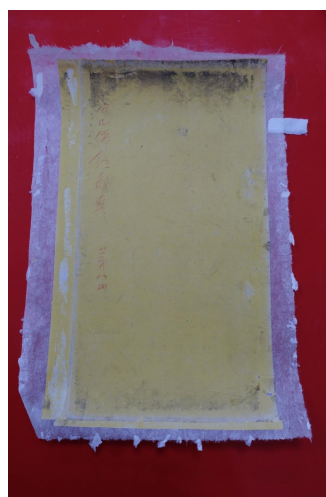
图6 书皮修补后托裱

(七) 书皮修补。书皮修补时用原书皮折叠部分的部分区域做补纸。由于折叠部分在内，保护较好，并未受损，颜色较新，在修补时可以用橡皮稍微擦一擦使颜色略发白更接近书皮破损周边颜色，尽可能和谐一致。由于书皮纸强度不高，书皮修补后托一层皮纸加固，上墙绷平。