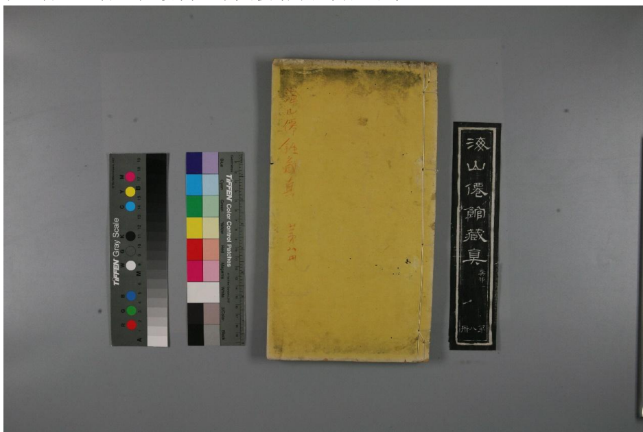
图8 整册修复前外观图

(十二) 贴签。由于原签条脱落，在贴签时需要根据签条的位置痕迹以及参考另外书册的贴签位置贴签。贴签后仍需上下夹板给小压力压平书签。