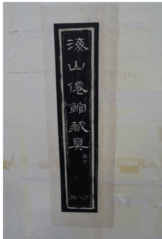
图7 书签修补后托裱上墙

(九) 锤书口。由于书口断裂，溜口修补后书口处略高出了一些，需要用锤子锤平。具体方法为书册放在石头上，