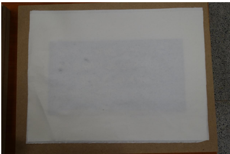
图5 书页和护叶修补后间接给水压平

(六) 润潮压平。拓本修复保持字口不变形是第一要务。故修补完以后的压平要慎重，为减少形变，考虑间接给水。具体做法是：将少量水雾喷在两张吸水纸上，将修补好的书页置于其上，再少量水雾状喷在另两张吸水纸上，上下压板，板上压大理石。修补完一页书页和其衬纸就润潮压平。所有书页及其衬纸修补完、润潮压平后仍须用大理石整体压平。