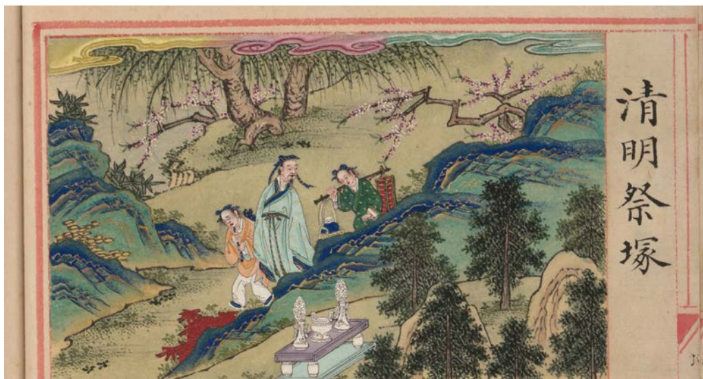
图1 《明解增和千家诗注·清明日》

如前所述，寒食上墓拜扫，“采菁草杂米粝为饵，谓之携酒祭奠”（《浙江通志》卷一百《台州府志》），是民间最为常见的活动。寒食与清明设假以后，因礼、法之规，上墓拜扫，便成为必须安排的假内活动。在唐代，帝王的拜陵、王公以下的拜扫，士庶的上墓奠祭，各有具体的仪式。皇室与六品以上官员可以参据《大唐开元礼》《大唐元陵仪注》；王公以下的祭奠，见于《通典·开元礼纂类十六·吉礼十三·王公以下拜扫·寒食附》等文本要求；其他官员也往往上行下效，如设席、奠爵进饌、哭泣辞莹等。寒食清明的祭奠活动，成为君、臣、民共同拥有的节日。圆仁《入唐求法巡礼行记》卷三载会昌二年二月，“十七日，寒食节。前后一日，都三日暇，家家拜墓。十九日，清明节。”宋高翥诗云：“南北山头多墓田，清明祭扫各纷然。纸灰飞作白蝴蝶，泪血染成红杜鹃。日落狐狸眠塚上，夜深儿女笑灯前。人生有酒须当醉，一滴何曾到九泉。”（《明解增和千家诗注》，另见《菊磔集》，题做《清明日对酒》）。图1）