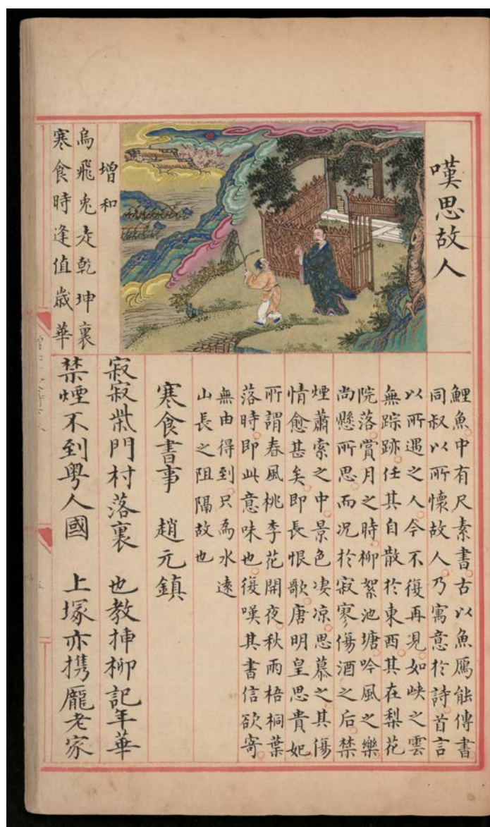
图2 《明解增和千家诗注·寒食即事》

民间寒食盛行斗草（李清照前引词）、镂鸡子、打球、荡秋千等游戏，以及郊游踏青、上墓祭扫，在白居易《和春深二十首》之十六皆有所见，“何处春深好，春深寒食家。玲珑镂鸡子，宛转彩球花。碧草追游骑，红尘拜扫车。秋千细腰女，摇曳逐风斜”（《白氏长庆集》卷二十六）。宋范成大《清明日狸渡道中》：“洒洒沾巾雨，披披侧帽风。花燃山色里，柳卧水声中。石马立当道，纸鸢鸣半空。墟间人散后，鸟鸟正西东。”（《石湖诗集》卷五，图3）。宋元以后的踏青游赏，在许多绘画作品中也有呈现。比如《百子团圆图》中的放纸鸢、荡秋千等（图4）。