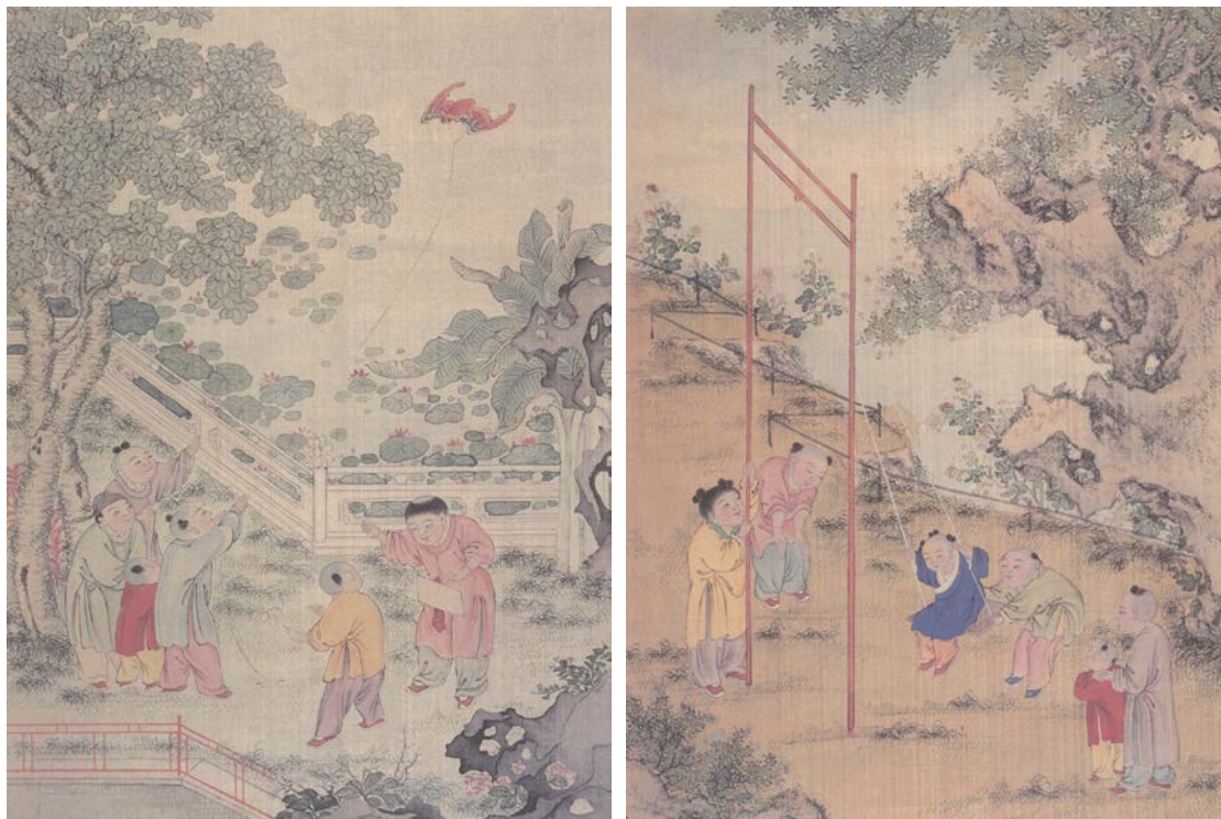
图3 《百子团圆图》（放纸鸢，荡秋千）