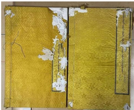
图 15 《大清律例附例》修复前破损情况

国家图书馆(国家古籍保护中心)将进一步推进本次修复成果和修复经验的发布与推广,推动国家古籍修复事业的科学化发展和高水平修复人才培养与队伍建设。