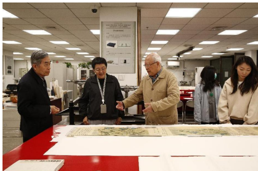
图 10 评审专家对舆图修复进行点评

徐建华等专家认真听取工作汇报,现场查看修复后文献,高度认可了此次修复项目成果,并展开了专业点评。