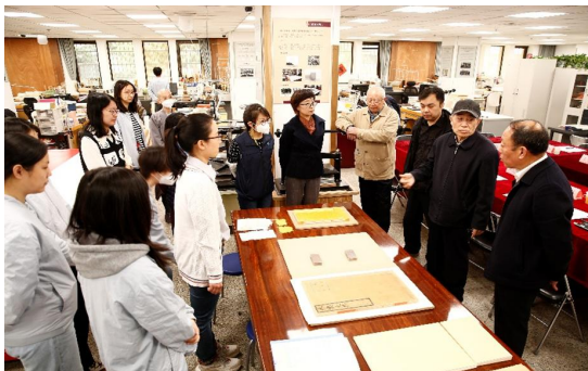
图 11 评审专家对拓片修复进行点评