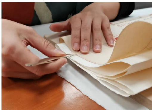
图4 修复人员采用“掏补法”对书叶折口缺损部位进行修补

本次《永乐大典》书芯的修复参考了之前成功修复的经验，在不拆除原装帧的前提下，对书叶进行“掏补”修复。