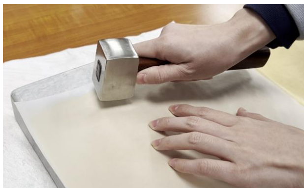
图6 染色后对绢料锤制加工

为使新绢在色彩上接近原件，修复人员参考了《明会典》中记载的黄色染料，再结合明代其他文献中的相关记述，辅助对书衣的分析检测结果，选择当时最有可能使用的传统植物染料对其染色并老化，再经锤制、全色等步骤，最终得到适合修复原件的补绢。在修复过程中，又借助体式显微镜等仪器设备对接口处的每根绢丝梳理调整，以实现最好的修复效果。