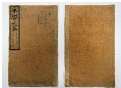
图2 修复前《永乐大典》前后书衣

中《永乐大典》“湖”字册的修复工作在科学化、精准化等方面取得的重大突破，获得了与会专家的一致好评。