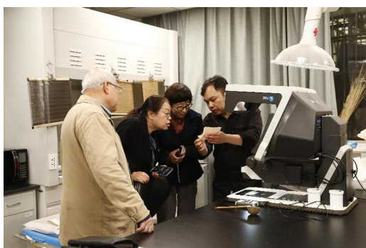
图 12 评审专家对藏品修复效果进行了现场勘验,并对具体修复技法、材料、设备等各自关心的问题与修复人员展开交流