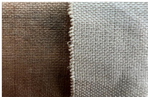
图5 修复人员自行织造的修补用绢（右）与《永乐大典》书衣用绢（左）效果对比

与此前不同的是，修复前对书叶用纸进行了纤维分析检测，据此从库存老纸中选择成分配比和颜色均相近的纸张作为补纸。此外，本次在书衣的修复上进行了一些新的尝试，不再局限于选购相近绢料用于修补，本次修复对《永乐大典》书衣用绢的绢丝粗细、密度等数据进行了准确测量，并经反复多次实验复原织造出与原件相似的绢质样品，再据此定制新绢。