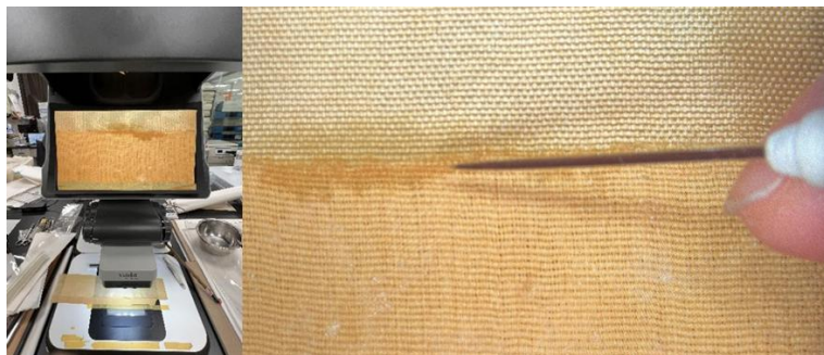
图7 修复人员借助体视显微镜等仪器设备修补破损书衣并对绢丝进行逐根拼接

这种绫绢仿制技术还被应用于本项目中《大清律例附例》书衣修复用绫的制作中，同时也为此后续绢类藏品的修复工作开拓了新的思路。