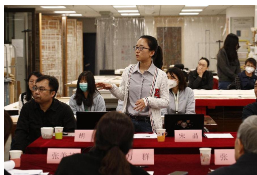
图 13 评审专家就相关问题提出质询,项目组逐一进行解答

故宫博物院书画修复技艺国家级非物质文化遗产代表性传承人徐建华认为,本次修复工作中传统工艺和现代技术的结合紧密,在绫绢纺织、复原染色、纸张和丝织品的应用等诸多方面都实现了科技手段的合理运用和多学科人才的充分调动配合。同时修复过程中还坚持了最小干预和修旧如旧的基本原则,原材料尽可能保留并再次应用,为日后对藏品材料、装潢等方面的研究和鉴定保留了珍贵信息。此外,为保留原装裱材料的裱轴拓片加装通天边等操作,也是对藏品做出了很好的保护措施。