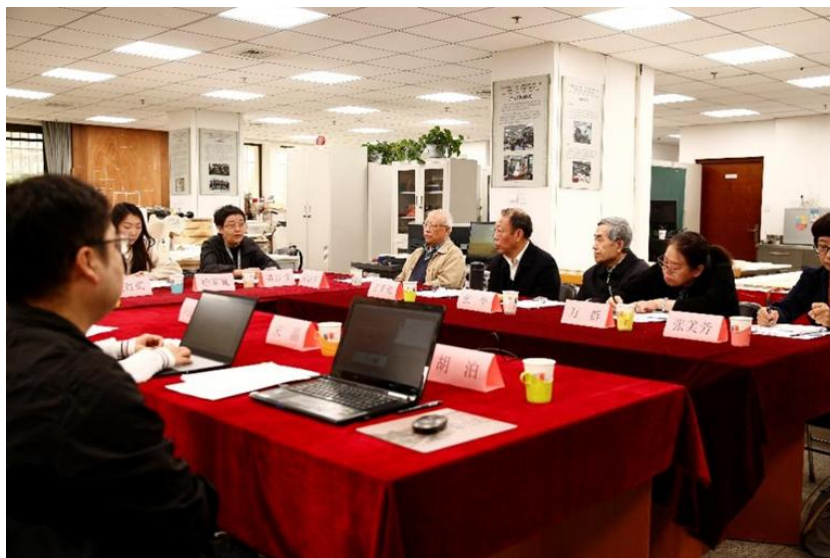
图9 古籍馆馆长陈红彦作项目介绍

国家图书馆古籍馆馆长陈红彦、国家古籍保护中心办公室主任王红蕾分别对本项目的发起背景、项目意义、修复过程等，以及政府主导、社会参与的合作模式做简要介绍。字节跳动公益古籍项目负责人徐家瀛也就社会力量对古籍修复事业的参与和支持发表看法，并对国家古籍保护中心、国家图书馆古籍馆对项目的支持和推动表示感谢。