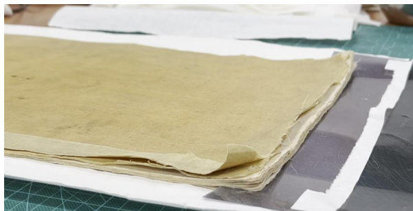
图3 修复前《永乐大典》书衣内层纸板严重分层空壳，丝绢面料严重缺损

本次《永乐大典》书芯的修复参考了之前成功修复的经验，在不拆除原装帧的前提下，对书叶进行“掏补”修复。