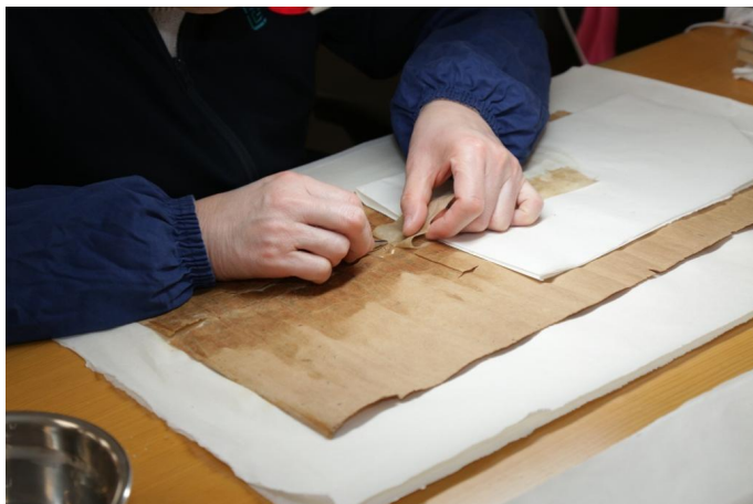
图1 修复人员正在揭补纸