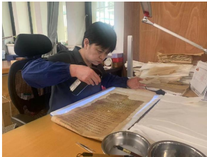
图5 修复专家正在喷压卷子