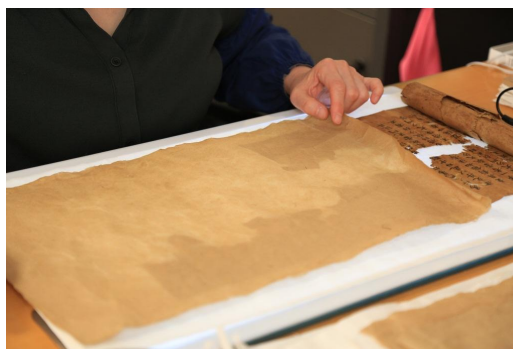
图4 修复人员接补卷首部位