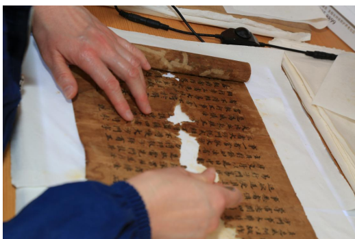
图3 修复人员修复文献缺损处

修复人员使用定制的修复用纸修补缺损部位（图3）。针对敦煌修复用纸相对厚实的特点，修复人员根据缺损部位形状撕出合适的补纸后，再行修复。