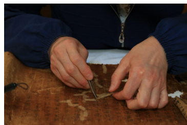
图2 修复人员用定制溜口纸溜口

修复人员使用抄制的相对较薄的修复用纸修补裂缝。根据裂口的大小、长短，结合纸张的具体特性调整用纸薄厚和溜条的宽窄（图2）。有的裂口呈树状长而发散，修复人员凭借多年的经验和过硬的技术将树状的裂缝修复完好，使正面不显破损痕迹，背面补纸整齐美观。