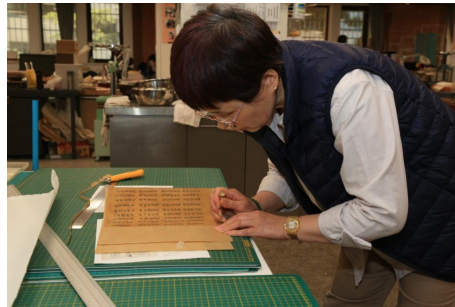
图6 修复专家正在裁齐卷子多余补纸

修复后的卷子表面平整、干净，边缘重叠、褶皱、卷曲处全部展开，断裂处连接完好，缺损处补齐，天地、首尾保护性接出并裁齐。原卷的信息如背面补纸等，能回归原位的全部回位，以确保文物信息的最大化保留。