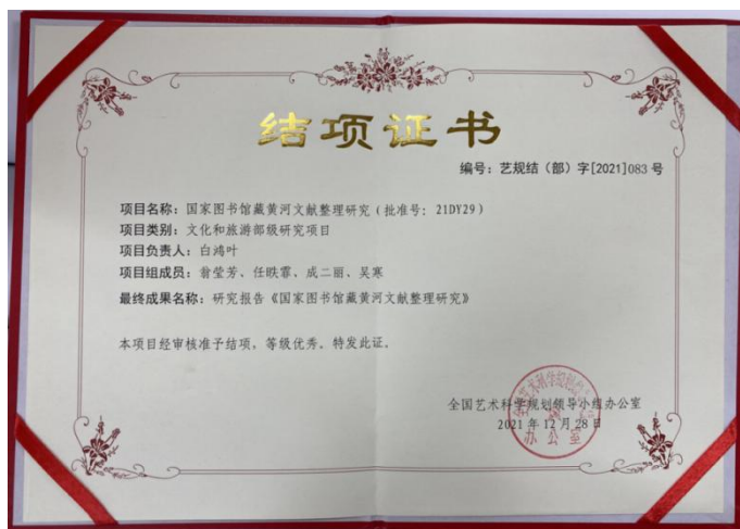
图3 文化和旅游研究项目《国家图书馆藏黄河文献整理研究》结项证书

文化和旅游研究项目《国家图书馆藏黄河文献整理研究》历时一年，于2021年12月正式结项。项目阶段性成果包括《国家图书馆藏黄河文献调研报告》1份和《国家图书馆藏黄河文献整理报告》1份，最终成果为10万字的《国家图书馆藏黄河文献整理研究》报告1份。该项目在结项审核时获得优秀等级。