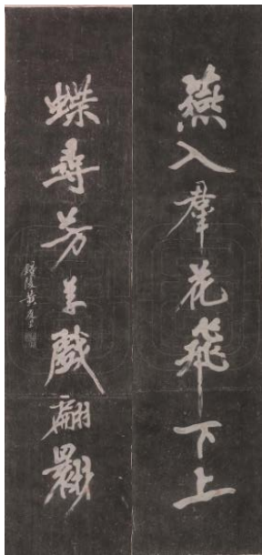
图 1 黄庭坚书楹联

黄庭坚（1045—1105），字鲁直，自号山谷道人，又号涪翁，洪州分宁人（今江西省九江市修水县），北宋诗人、词人、书法家，为“苏门四学士”之一，书善行、草，为“宋四家”之一。