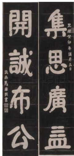
图 20 马维骥书楹联