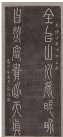
图 19 任廷贵书楹联

马维骥（1846—1910），字介堂，云南开远人，武将，官至四川提督，诰授建威将军。习武之余勤于诗书，书学颜体，笔力浑厚。