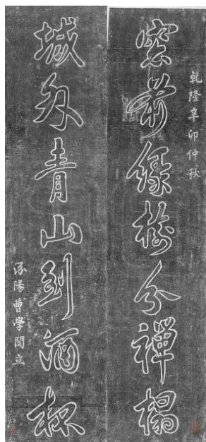
图5 陶然亭曹学閔楹联