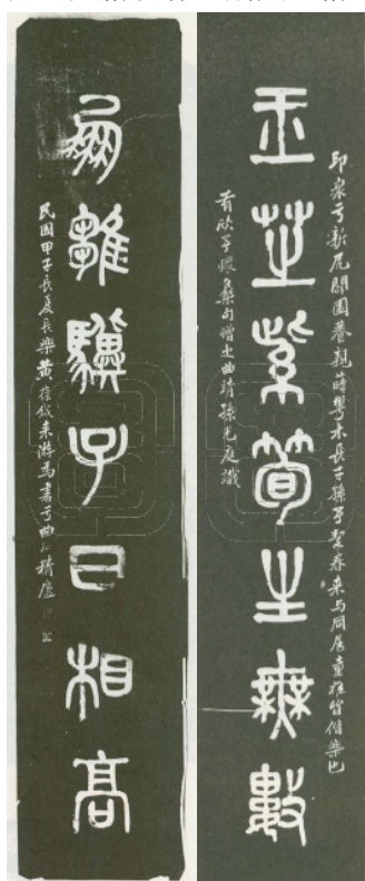
图 21 曲石精庐楹联

冯玉祥（1882—1948），字焕章，安徽省巢县（今巢湖市）人，民国时期爱国将领，军事家、政治家。从政之余，习书颇勤，书法以楷书、隶书、行书为精，尤其是隶书，线条自然、风格古朴，别具一格。