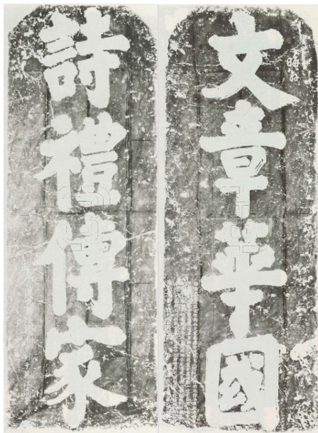
图 2 朱熹书联