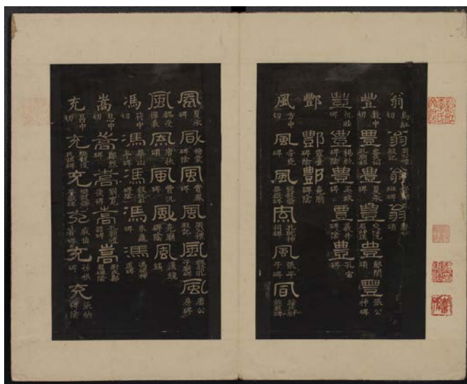
图1《隶韵》第一册正文

此拓本为汇集汉隶字形而成的隶书字典，又称“碑本隶韵”“碑文隶韵”“四声隶韵”。全本十卷，以楷书字体为字头，下注反切，依“平上去入”四韵排列，字头下辑录两汉以来墓碑、祠庙碑、纪事碑、熹平石经、铎、钲、盆、镜等金石器物上的隶书字形，所引隶字下分别标注出处，所引诸金石碑刻今多不存（图1）。