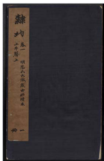
图2《隶韵》第一册赵之谦题签

馆藏此本残存九卷八册，缺卷四，另缺碑目，所存九卷惟卷三、卷五完整，其他卷次各有缺损。馆藏拓本青素绢封面，五镶册页装，册高34厘米，宽21厘米，墨心高25.5厘米，宽15.8厘米。经明代范大澈、清代黄氏一层楼、卢登焯、沈树镛、李鸿裔等递藏。有赵之谦题签，钱大昕、卢登焯、钱维乔题跋，吴大澄、吴云、杜文澜、顾文彬等观款，有范大澈“范大澈印”“沧瀛外史”“句章灌园叟”“卧云”印，钱大昕“钱大昕印”“孱守斋”“竹汀”“晓微”“大昕私印”，李鸿裔“苏邻鉴藏”“鄞江李氏文房”，蒋祖怡“蒋祖怡印”“穀孙”印，赵烈文“能静经眼”等鉴藏印。此拓本入选第一批国家珍贵古籍名录，名录号为00389。