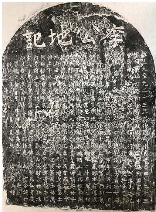
图 1 李子才地券

第三批是山西省太原市的石刻拓片，共计 139 种 217 张。该批拓片石刻类型多样，内容丰富，包括祠庙碑、楹联、画像、造像、匾额、经幢等石刻类型，比较多样地体现山西太原当地的石刻文化特点。该批文献以山西太原文庙石刻为主体，是对文庙碑刻的集中传拓，内中《观音庙碑》《文庙石刻画像》《三官庙碑》《真武阁碑》《关圣