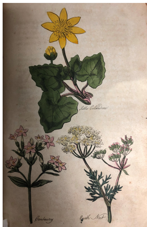
The family herbal