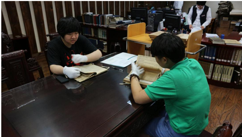
图2 浙江省图书馆曙光路总馆阅览室查阅珍本志书工作照