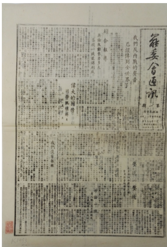
《罢委会通讯》创刊号

《罢委会通讯》，共存15期（包括2期增刊）。日刊。每期8开2版。《罢委会通讯》是昆明市中等以上学校罢课联合委员会的机关报。1945年12月1日出第1期，第11期后不定期出版，12月27日出至第15期停刊。12月16日和12月21日曾出过2期增刊。该报栏目有社论、评论、来信、消息、通讯等，详尽地报道了从“一二·一”惨案发生到12月27日复课期间爱国学生的斗争过程，揭露了国民党当局残杀学生，阻挠、破坏学生运动的罪行，指出了学生的正义要求，反映了广大学生的呼声，是指导当时学生运动的理论刊物，深受师生和各界群众的欢迎。