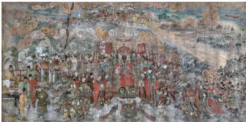
广胜寺水神庙壁画