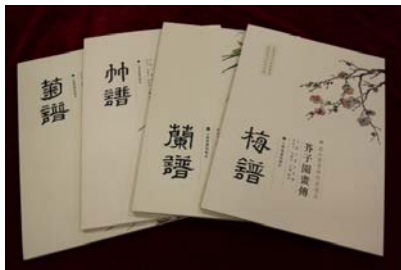
《芥子园画传》清代画技法图谱 梅兰竹菊谱 四册成套