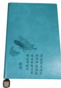
芥子园画传软抄笔记本