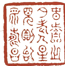
春分之夕老人星见则治平寿昌

印文“春分之夕老人星见则治平寿昌”。见于《晋书·天文志》，云：“老人星在弧南，一曰南极。常以秋分之旦见于丙，春分之夕见于丁，见则治平，主寿昌。”老人星，一名南极星，又称南极老人，据称，其星主太平、国运、长寿，古人观测老人星特设春分、秋分两个时节以作占星应事。