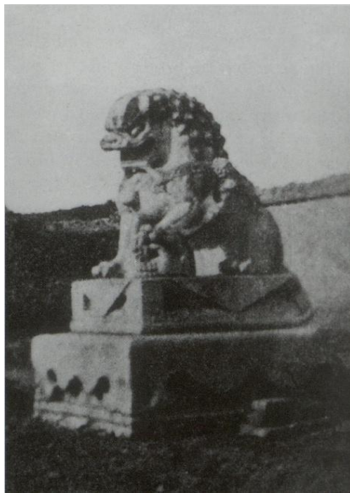
20世纪30年代美国人麻伦在长春园遗址上拍摄的大东门石狮旧照

1929年5月11日，国立北平图书馆新馆舍奠基开建。新馆舍的建筑外观采用华丽的中国传统宫殿式结构，外墙颜色借鉴了故宫文渊阁的绿色，古色古香，十分