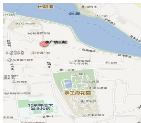
图4 2015年“百度地图”中原李广桥一带

李广桥下的月牙河蜿蜒向南，从民国年间的北京地图可见，两岸的道路分别是李广桥南街和李广桥西街。（图3）这条窄窄的河道一方面要往城内输水，另一方面又要负荷沿岸居民排入的生活污水。由于疏