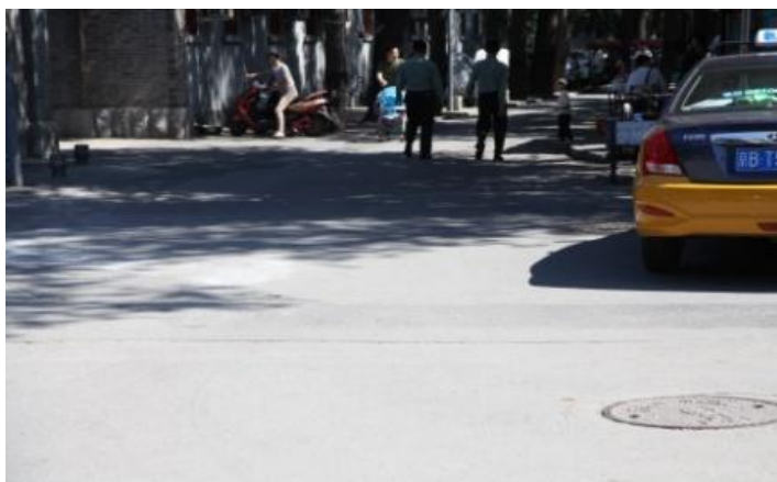
图 5 原李广桥旧址（2015 年摄）

从现在的地图上，已经看不到李广桥、李广桥斜街，最显眼的是曾经的李广宅院、现在的京城旅游景点——恭王府。（图 4）走在这里，周围是喧闹的人流和叮叮当当的人力车在招揽胡同游生意，而历史，就被踩在人们的脚下。（图 5）