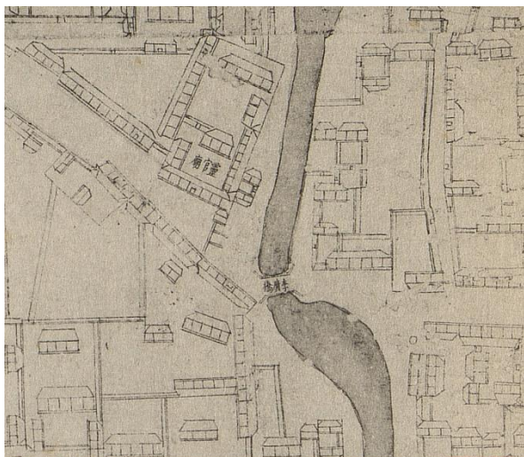
图1《乾隆京城全图》中的李广桥

这个李广深得皇帝宠信，加之明代的宦官专权，李广的权势非常大，在东依前海、背靠后海的地方置业修建了私宅。明代中期北京供水渠道的改变，使得李广家的墙外出现了一条河道，即月牙儿河，李广硬是把河水引进了自家，又借此在桥上修建了一座石桥，即李广桥。传说中北京的龙脉，一是故宫的龙脉，即土龙；二是