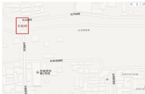
图 2 百度地图上的东板桥

东板桥于 1958 年拆除，内府大街于 1949 年后也改成东板桥街。因内府大街的地理位置没有改变，所以在实地踏查中，东板桥的历史地理位置还是在东板桥街的最北端。2013 年 11 月份拍摄的照片显示东板桥街的北端及北河胡同一片地区正在拆迁改造。（图 2、图 3）