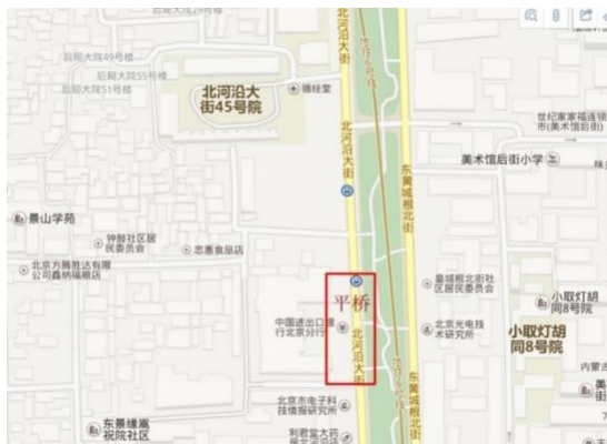
图5 百度地图上的平桥

实地踏查中发现，平桥所在此段御河现已成北河沿大街及旁边的绿化带，而平桥曾经所在位置大概就在北河沿大街上，（图6）百度地图中的红色区域位置。（图5）