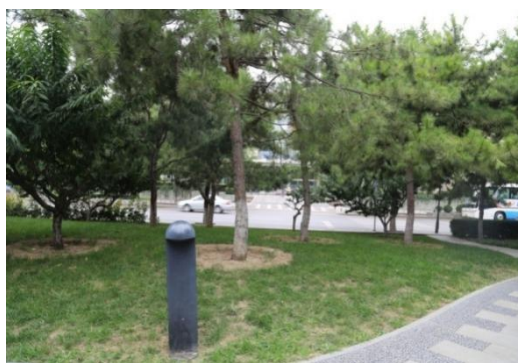
图6 平桥原址（2014年9月摄）