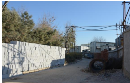
图 3 东板桥（2013 年 11 月摄）