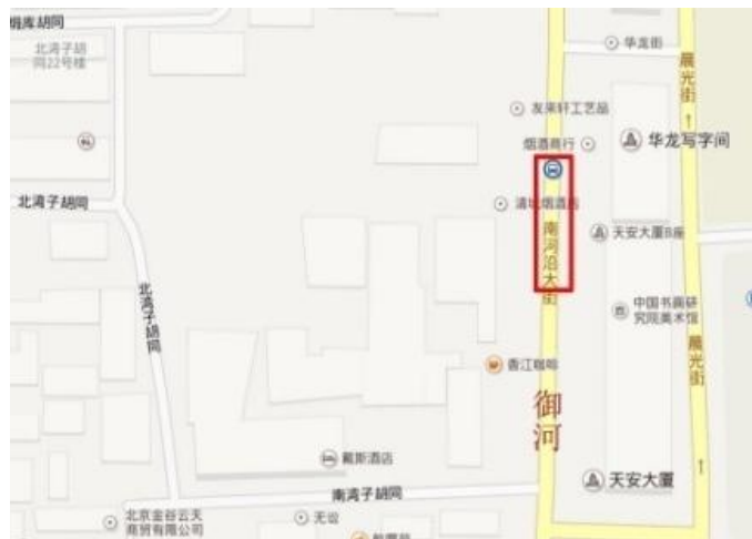
图 3 百度地图南河沿大街

鞍子桥就在南河沿大街上，定位鞍子桥的地理位置是有难度的，除非南河沿大街翻新修建，有可能会在地下找到它的一些遗迹。现如今，我们只能根据《乾隆京城全图》上鞍子桥的所在位置大致分析出来。（图 2、图