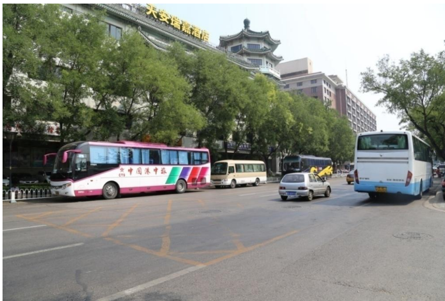
图 4 原鞍子桥所在位置

鞍子桥西面的城区往南有一条东西走向的湾字胡同，现在叫南湾子胡同。这条胡同的西北城区方向还有条东西走向的胡同也叫做湾字胡同，现在叫北湾子胡同。通过《乾隆京城全图》和现在地图对比来看，由于这两条胡同的地理位置基本没有变化，所以，鞍子桥所在的地理位置大概就是图 3 中红色所框区域。根据实地踏查考证，图 4 为原鞍子桥所在的位置。