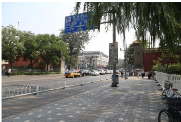
图 2 半边桥（2014 年 8 月摄）

从乾隆图中可以看到半边桥的西边还有一个天妃闸。天妃闸位于菖蒲河段上（菖蒲河是明清皇城中外金水河的东段），其由左右两个龙头口衔着铜质闸板构成。现在的菖蒲河公园里保留了天妃闸遗址，菖蒲河水从东向西缓缓流淌，在天妃闸处形成一个小瀑布景观。实地踏查得知，半边桥的历史地理位置应在天妃闸的东南方向，即南河沿大街上。（图 2）