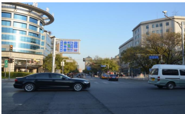
图2 皇恩桥旧址(东安门大街和北河沿大街交叉路口)

在老北京，有“庙里有井，井里有庙”之说，说是在东岳庙里，一座小的龙王庙建在一眼井的井壁内。与之对应的是“桥上有庙，庙里有桥”的皇恩桥。有记载说皇恩桥上有一座砖瓦小真武庙，全称“皇恩桥玄真观”，庙中祭祀真武大帝，庙里还有一座小石桥，因此有了“桥上有庙，庙里有桥”的传说。庙内建筑主要有山门、正殿及配殿。院内有《光绪重修碑记》和民国十二年