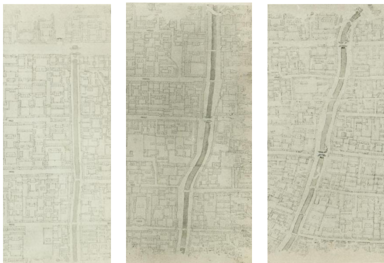
图1《乾隆京城全图》中的西沟沿

因为这条故道所处区域居民众多，故而河道上架设了很多桥梁。对于桥梁的数量有不同的说法。根据清宣统元年（1909）出版的《详细帝京輿图》所标注，横跨此河道的有桥