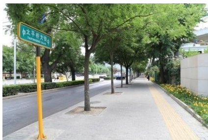
图 3 太平桥所处位置今貌

太平桥所处位置今为二龙路西街与学院胡同交汇处，原南北向的大明濠现为太平桥大街。(图 3、图 4)