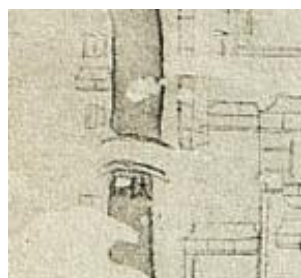
图 2 太平桥形制结构

赵登禹，沟沿大街北段改称赵登禹路，南段改称佟麟阁路，中段的鸭子庙、太平桥、西京畿道统一称太平桥大街。《京师坊巷志稿》中记载：“鸭子庙，关帝庙俗