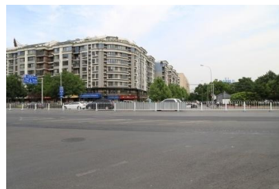
图 4 今太平桥大街