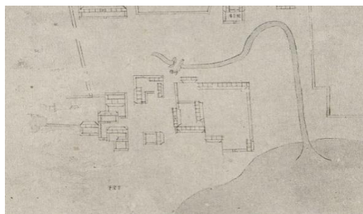
图 2 砖桥放大图

建之时，这条故道被大都南城城垣在今长安街一线截断，下游部分则变成一条断头河。明代初年，内城城墙南扩，新的内城南城墙再次截断河道，北段即为今北新华街一线，南段为外城南新华街一线，经虎坊桥汇入先农坛（《乾隆京城全图》标为山川坛）西北的一片苇塘，旧时称为虎坊桥明沟。虎坊桥明沟在汇入苇塘后就折向正东，穿过前门大街，绕天坛北侧、东侧，经左安门西水关注入南护城河。