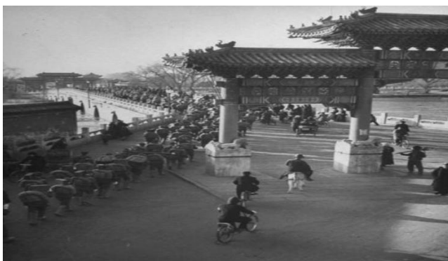
图3 玉蝮牌楼近景旧照（拍摄年代不详）

（图2）桥面以石板铺砌，整个桥身东段坡度最大处为5%，西段坡度为4%，桥面较窄，纵坡度很大（1951年实测）。东西两座牌楼均为三间四柱三楼式牌楼，立柱不出头，每间有坊额，四柱有四方基座。根据玉蝮牌楼的老照片，可知牌楼为单檐庑殿顶，脊