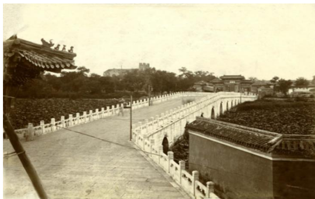
图2 金鳌玉蝮桥原有汉白玉栏杆（1901年摄）

栏杆，望柱除角柱为五边形外其余均为平顶方形覆莲。栏杆间栏板为柱板相间的节间式，栏板镂空，上方雕饰有束竹式寻杖和云拱，下方内外板心有海棠池雕线。