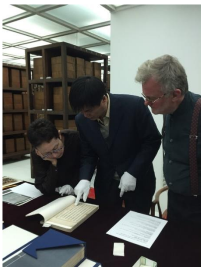
和汉庭顿图书馆人员挑选展品

《园林/艺术/商业：中国木刻版画》展是在美国汉庭顿图书馆举办的多单位合作展览，我馆与上海博物馆、南京图书馆受邀参展，共