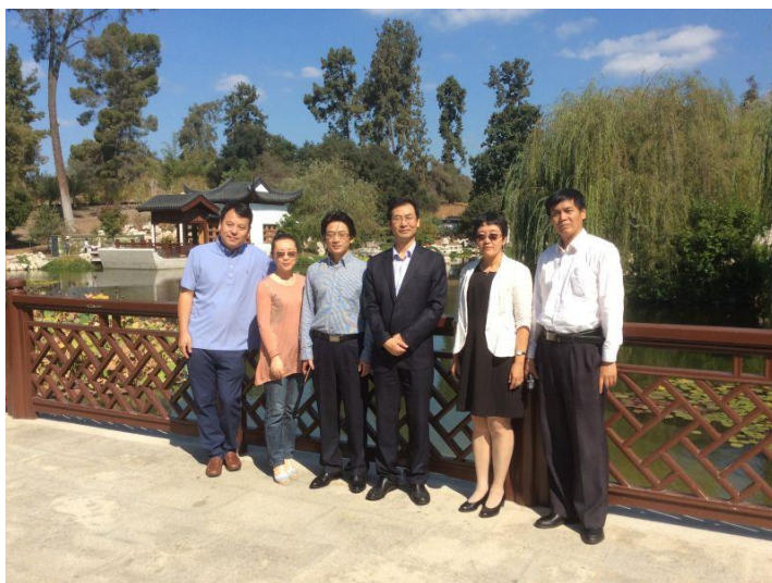
中方布展人员及参加开幕式领导

参与此次展览筹备及布展工作当中，充分体会到几方人员对待工作的职业精神、专业精神、契约精神和人文情怀，收获颇丰。