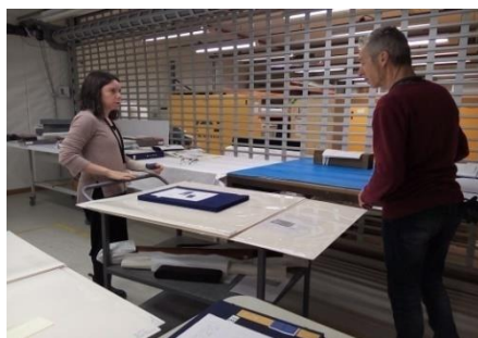
将展品原包装送到展厅

号，序号的颜色跟展柜区域的颜色一致。取包装材料的两位老师往返于库房和展厅之间，按照撤展顺序每次取走几种包装材料，提前放在为撤出展品专门搭建的工作台一角。