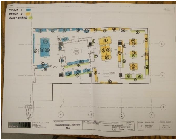
标有不同颜色的展品布局图

撤展归来已经两个多月了，在那里工作、生活的很多细节仍历历在目：展览团队的敬业与专业、澳方几位老师的热情与友善、大家对