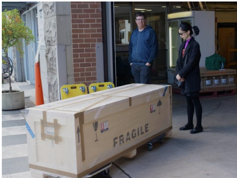
展品运输箱出库等待装车

达到规定时间，员工会按照这一规则，自觉补上所缺时间，无需监督；再如，堪培拉的街道岔路和弯道很多，在主路行驶的车看到岔路上有车驶入，不用犹豫