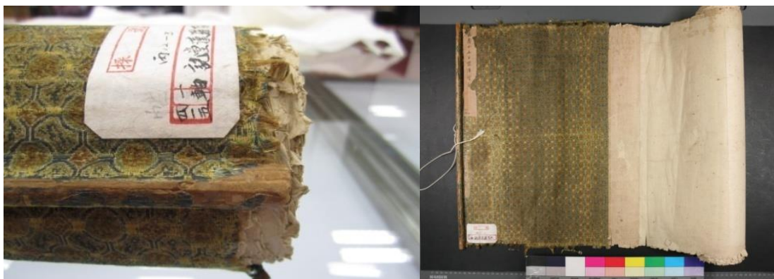
《五百罗汉图》修复前外观及包首

我们的时间只有四十天，工作日实际只有三十天，而这件藏品上下边缘和卷首都破损比较严重，墨芯多处有空壳现象，最好的方法是整体揭裱，小修小补是不可行的。当时放在我们面前只有两个选择，要么不动，要么大修。由于裱件破损严重，原封不动拿去展览是根本不可能的，所以我们只能选择后者，可以说是硬着头皮啃这块硬骨头，其工程量之大之艰难可以想象。