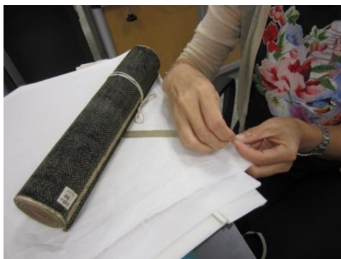
为《泾清渭浊图》卷缝上别子

复中的藏品每天下班前存入善本库房，第二天上班后再从库房提出来继续修复，中午吃饭时间也始终保证修复室不离人，这种早提晚归的方式就决定了修复工作的进度不可能快，只能每天进行一点儿。我们这样早提晚归连续坚持了四个多月，逐步完成了《木兰图式》、《盛朝七省沿海图》、《至圣先师孔子林图》、《泾清渭浊图》、《犬伯罍》、《御题棉花图》等藏品的主要修复工作。