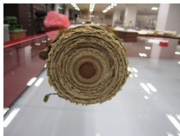
修复前的《五百罗汉图》

四十天的时间，完成一件手卷形式的藏品的揭裱工作，而不是装裱工作，任务是非常艰巨的，尤其这件手卷仅墨心部分就多达18米之多，时间的紧迫程度可想而知。