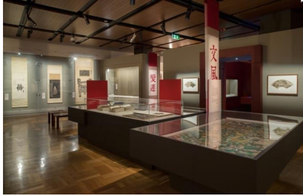
修复后的藏品在展览中

此次修复让我们的藏品得到最大程度的保护的同时，漂漂亮亮地展现在了澳洲观众面前，修复过程尽管很辛苦，我们也承受了很大压力，但能够安全地如期完成这一艰巨而神圣的任务，我们由衷地自豪。