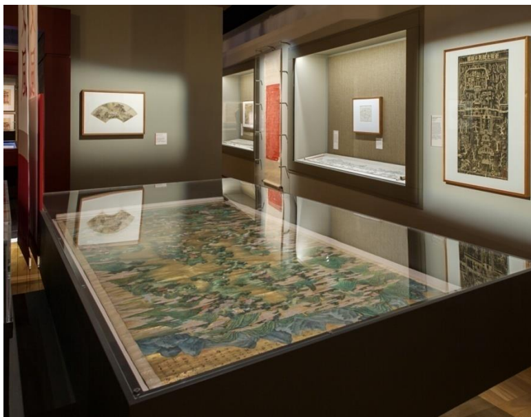
展览中的《西湖全景图》

早在2015年5月，我们修复组就开始陆续接到澳展藏品展前修复的任务，由于当时修复工作室改造后新近搬迁回来，安防还没有到位，工作室内还不