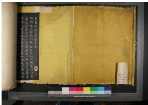
《五百罗汉图》修复前局部

手卷形式的藏品由于构成部件多、结构复杂，装裱修复往往比较费时，少则三个月半年，多则一年甚至更长时间的情况都是有的。然而这件清乾隆乌金拓本《五百罗汉图》留给