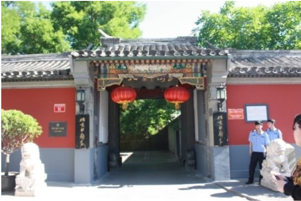
图 4：同在绒线胡同的勋贝子府，位于辅国公成保宅西侧，今天以北京中国会得以保留。两府同街却不同命。

如今贝子府被保留下来了，为“北京中国会”，位于西绒线胡同 51 号，靠近宣武门内大街。对比《乾隆京城全图》，辅国公成保府位置与贝子府大致相当。故而有些资料称二府乃为同一地点。然而，辅国公成保府被称“光公府”应该在光绪二年（1876）光裕袭爵之后，而贝子府始建于同治八年(1869)。再综合《京师坊巷志稿》的记录可知，二府确实不在一处。如今“北京中国会”占用的勋贝子府应与辅国公成保旧址无关。遗憾的是，今天辅国公成保府已经无迹可寻了，现在西绒线胡同 45 号大致是成保宅的位置。