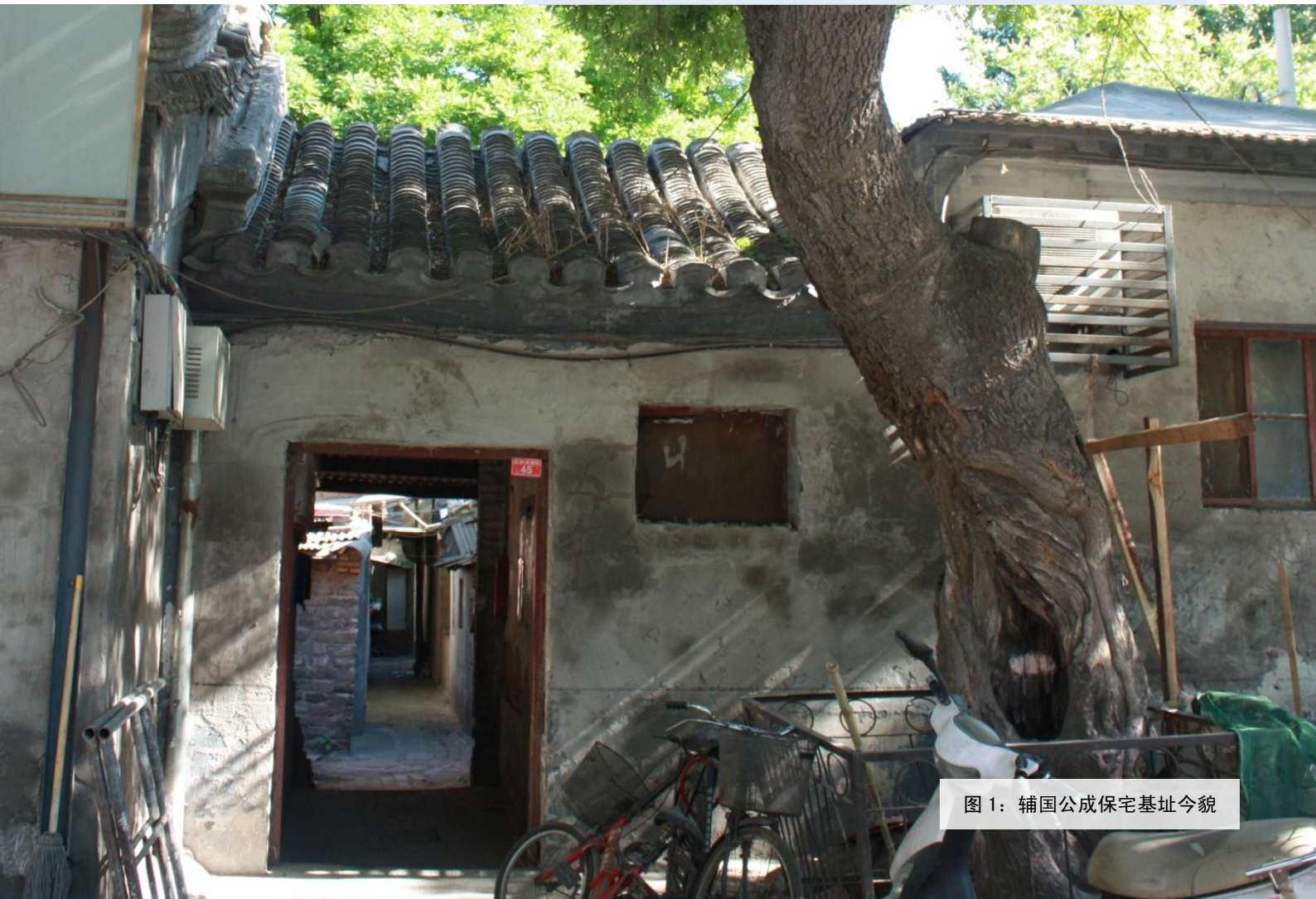
图 1：辅国公成保宅基址今貌

辅国公成保是努尔哈赤长子褚英的后代，其高祖父为褚英长子安平贝勒杜度。根据《京师坊巷志稿》引述《啸亭续录》曰“贝勒杜度宅，在绒线胡同。”由此可知，杜度及其后人宅邸乃位于宣武门内大街东侧的绒线胡同内。