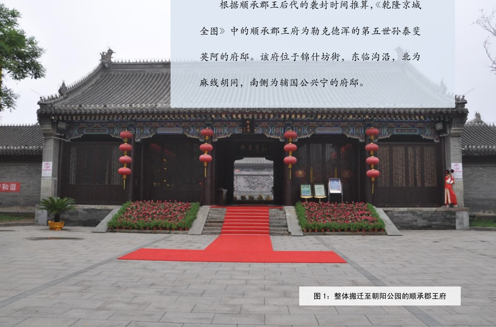
图 1：整体搬迁至朝阳公园的顺承郡王府

根据顺承郡王后代的袭封时间推算，《乾隆京城全图》中的顺承郡王府为勒克德浑的第五世孙泰斐英阿的府邸。该府位于锦什坊街，东临沟沿，北为麻线胡同，南侧为辅国公兴宁的府邸。