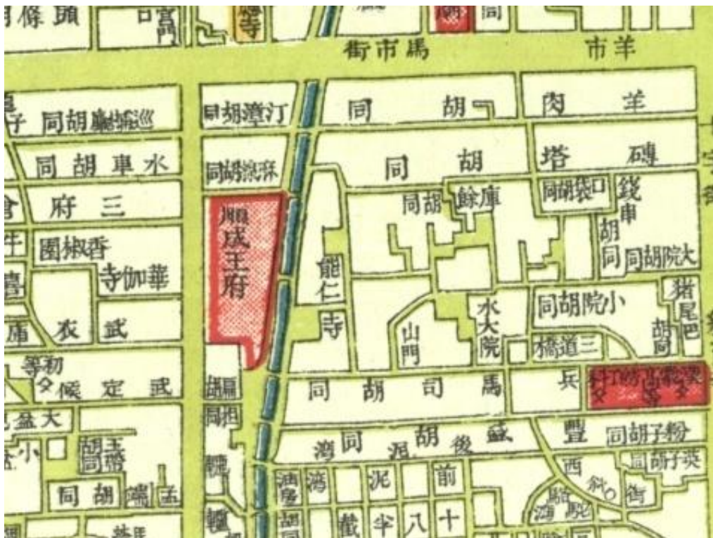
图 3：1923 年《最新北京全图》中仍然为“顺成王府”

民国六年文葵又将王府租给皖系军阀徐树铮，不久，奉军攻入北京，皖军南逃，顺承王府就被奉军的汤玉麟当作战利品接受，并住了进去。