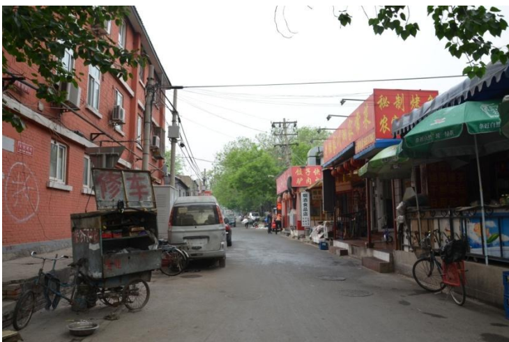
图 4：府邸旧址南侧的院儿胡同