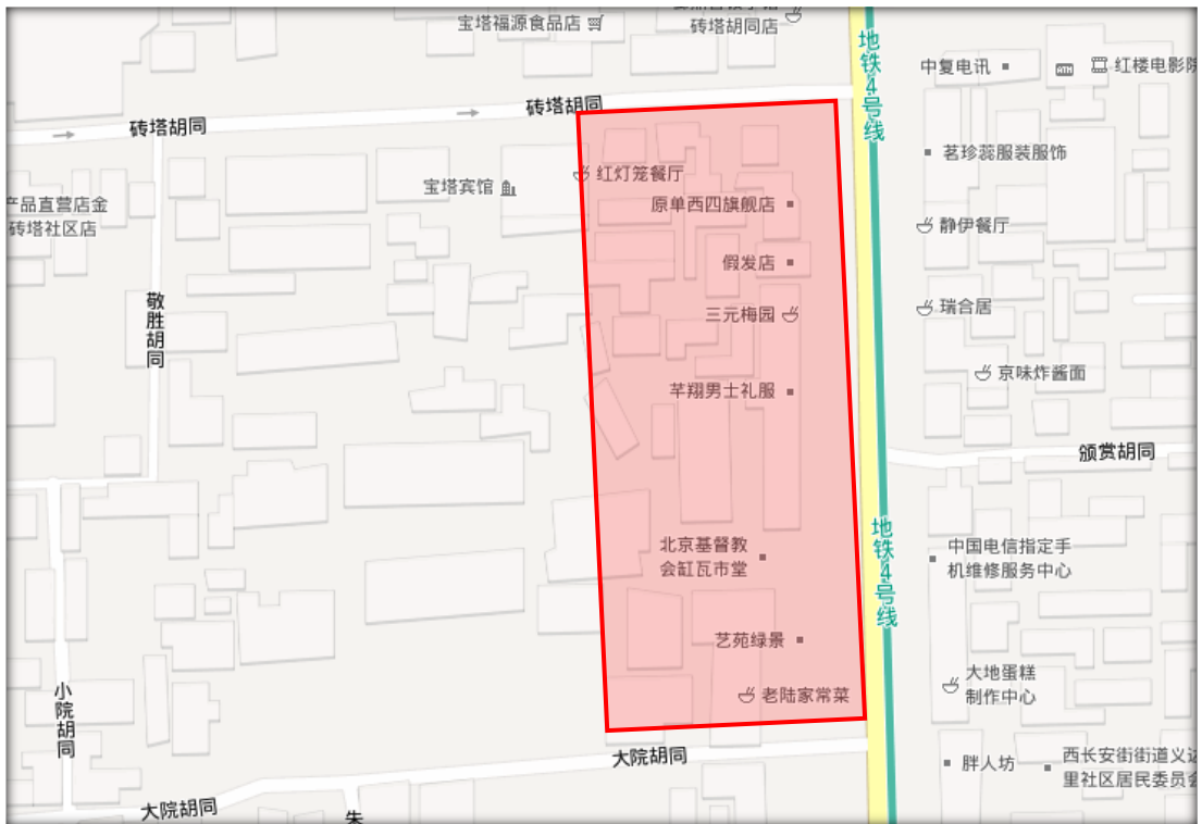
图 5：原府今无存，其址上为缸瓦市教堂等建筑