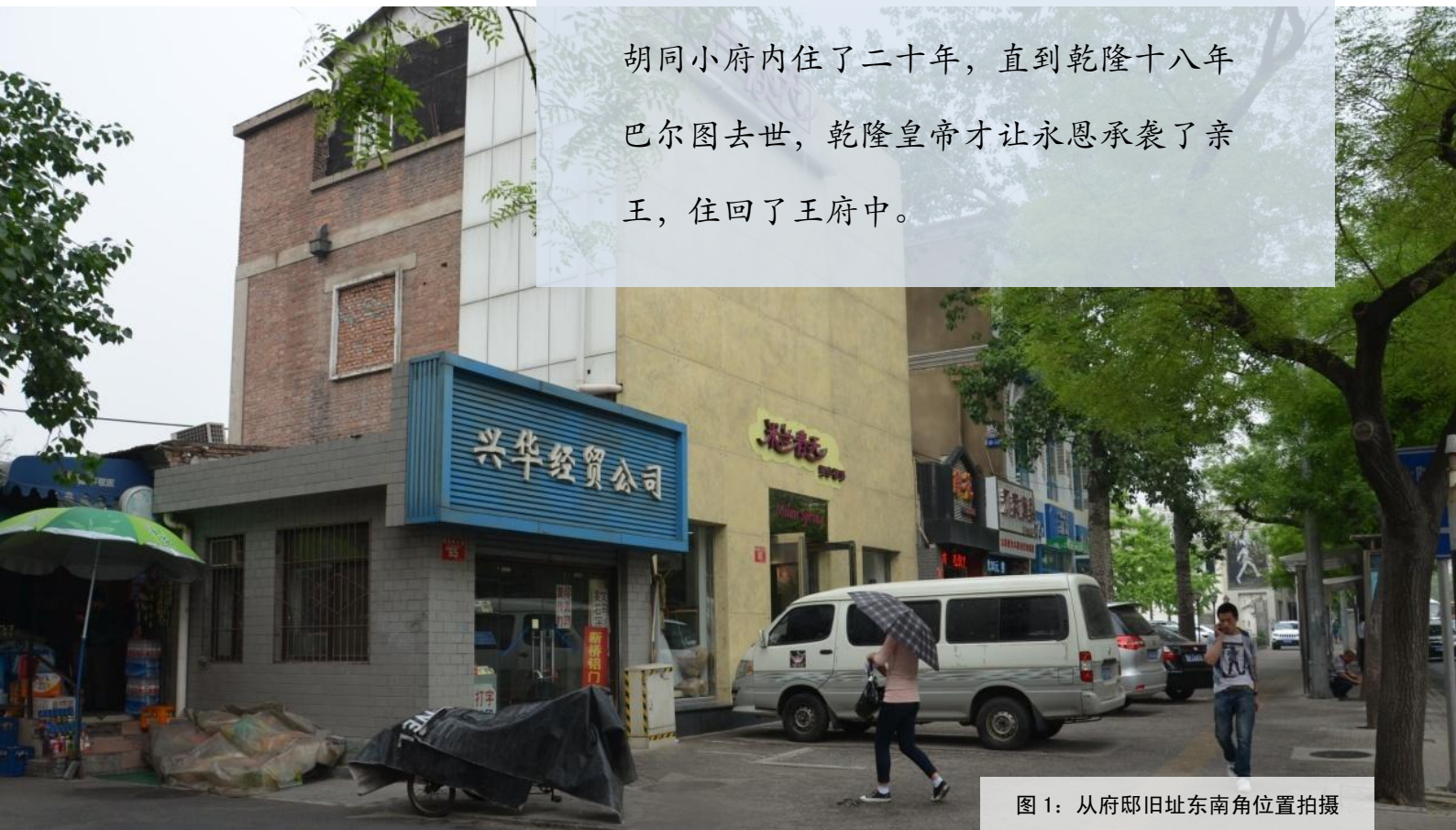
图 1：从府邸旧址东南角位置拍摄

康亲王崇安去世后，崇安之子永恩是当然的继承人，但在雍正十二年（1734），雍正皇帝却选中了永恩的伯祖父巴尔图承袭亲王，只封永恩为贝勒，永恩在西四大院胡同小府内住了二十年，直到乾隆十八年巴尔图去世，乾隆皇帝才让永恩承袭了亲王，住回了王府中。