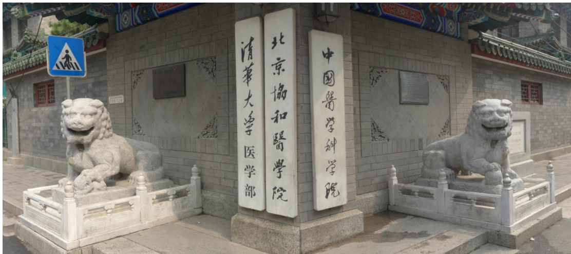
图 5：信郡王府门前的懒狮

今天的协和医院，外面挂着中国医学科学院、北京协和医学院、清华大学医学部的牌子，门前的一对石狮是王府时期唯一的遗物，也是北京清代所有王府门前仅有的卧狮。懒洋洋趴在须弥座上的石狮，被民间百姓亲切的称为“懒狮”，传这个王府的王爷不追求名利，懒散如同这对石狮。昔日的铁帽王府，今天只剩下这对石狮来见证王府的历史了。