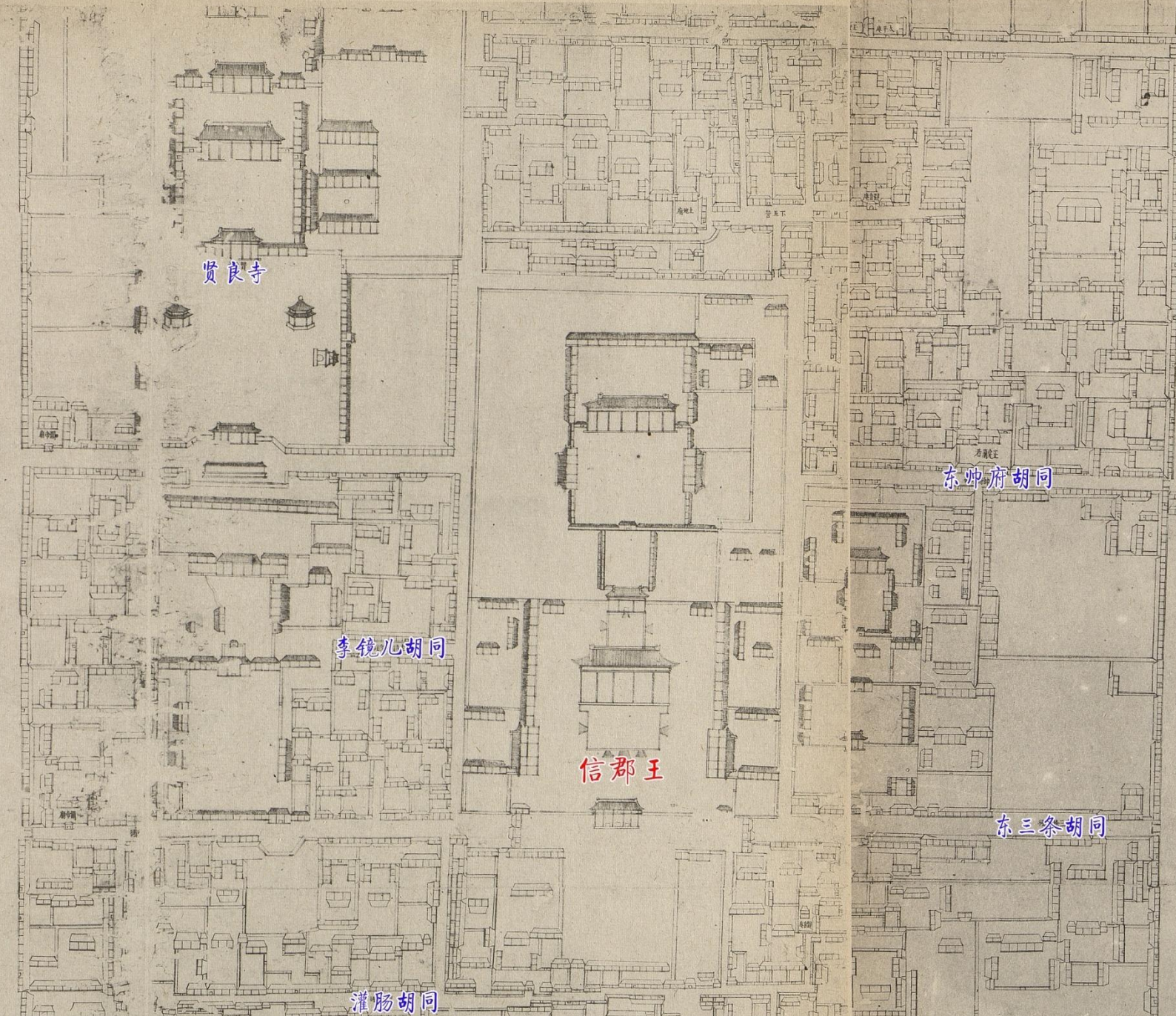
图2：《乾隆京城全图》中信郡王府（豫亲王府）及周边