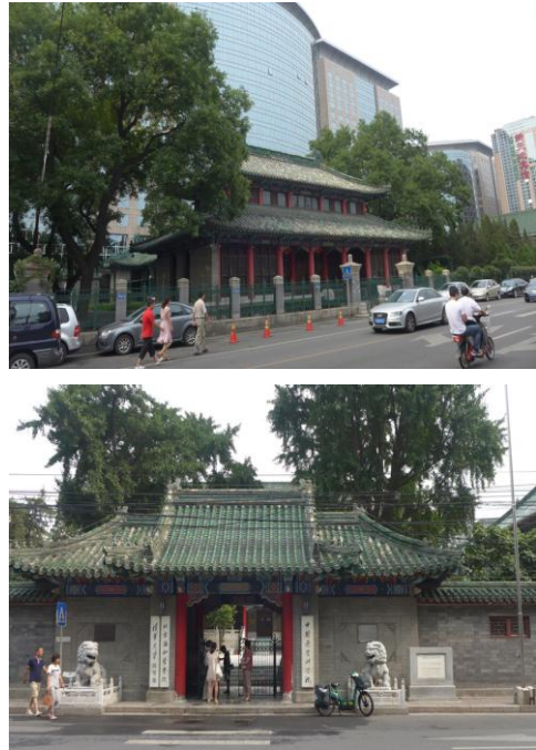
图3：现在的协和医院南院和北院

1941年珍珠港事件后，协和医学院被日本人接管，直至1946年复校，1947年医学院恢复招生，1948年复诊。1985年，协和医学院改称中国协和医科大学。