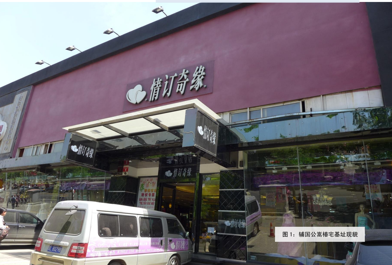
图 1：辅国公嵩椿宅基址现貌

《乾隆京城全图》第七排第九行靠南、第八排第九行靠北有一座府邸，为奉恩辅国公嵩椿住宅。嵩椿的爵位承袭自其祖芬古（一名费扬武）——显祖宣皇帝塔克世之孙、追封庄亲王舒尔哈齐（努尔哈赤弟）的第八子。