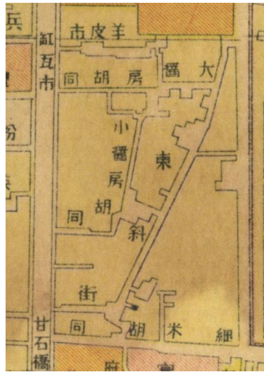
图3: 1919年《新测北京内外城全图》中嵩椿府相关区域的标注

据冯其利《寻访京城清王府》一书记载，到二十世纪二三十年代，这里成为秀贞女医院所在地，秀贞为北洋政府交通总长兼交通银行经理叶恭绰(1880-1968)儿媳的名字，其全名为叶姚秀贞。从1935年的《最新北平市详细全图》